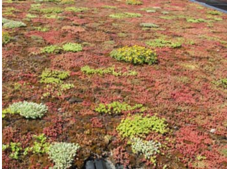
Grönt tak (sedumtak)

av området. Eventuellt överskottsvatten kan ledas bort via den närbelägna dagvattenledning som går genom området från norr till söder.