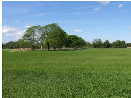
Planområdet från norr