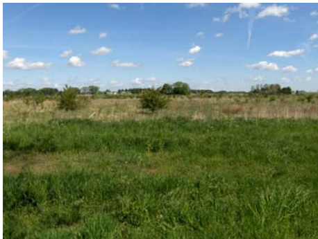
Planområdet från söder

Området utgörs av åkermark, där södra delen inte längre odlas utan består av gräsmark med träd och buskar. Vid Åsavägen i norr och i östra delen av området finns bostadsbebyggelse.