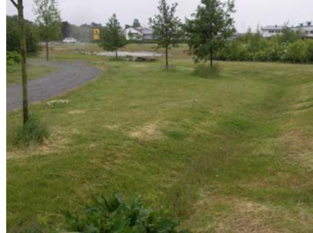
Uppsamlingsdike för dagvatten