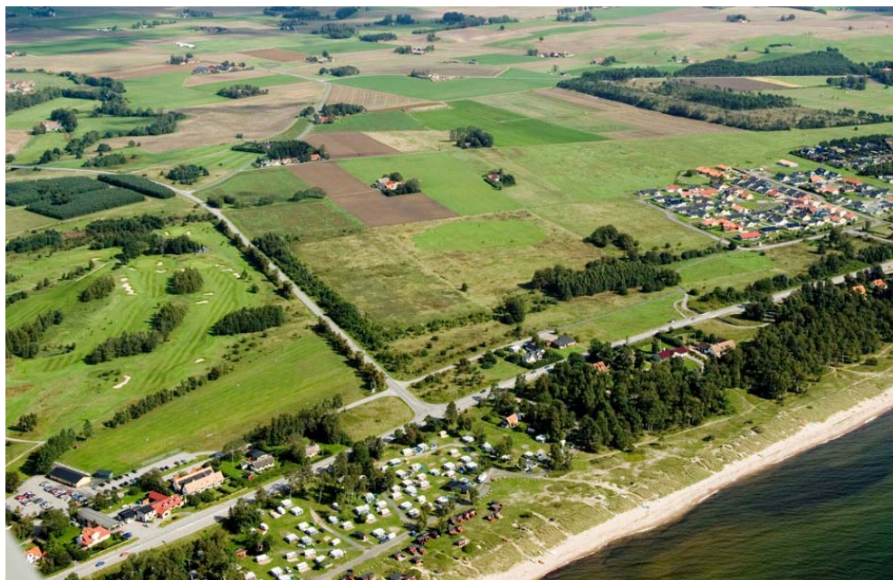
Flygfoto över planområdet

En begäran om detaljplan för i huvudsak bostäder för området väster om det senast exploaterade området i Nybrostrand har kommit in från Ystads kommuns exploateringsverksamhet. Samhällsbyggnadsnämnden har gett Plan o Bygg i uppdrag att i detaljplan pröva föreslagen markanvändning.