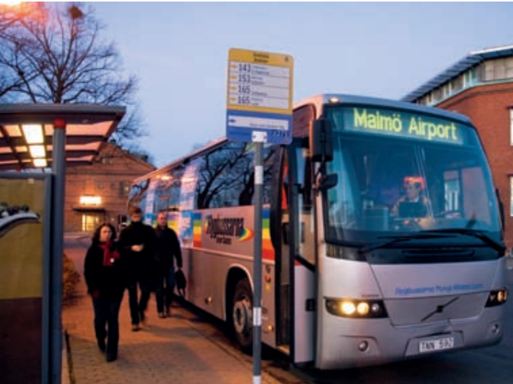
Från Ystad till Sturup via Svedala - snabbt, billigt och miljövänligt.

Fyrtiofyra minuter. Längre tid tar det inte att åka kollektivt från Ystad till Malmö Airport, Sturup. Med Skånekorset i nyan, eller 35 kronor för bussbiljetten, kommer du snabbt och enkelt i tid till flyget, sparar miljön och får tid att koppla av en stund på vägen.