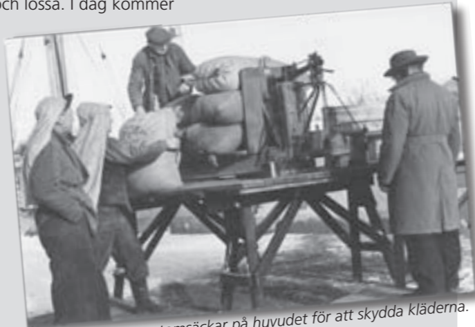
Förr bar stuvorna tomsäckar på huvudet för att skydda kläderna.

det kanske 10-15 fartyg på ett år. Jag kan tycka att det är synd att det blir allt mindre aktivitet i hamnen, det är ju nerven i Ystad. Att det dessutom är stängsel runt om tycker jag är trist, men det är ju EU-regler som styr det.