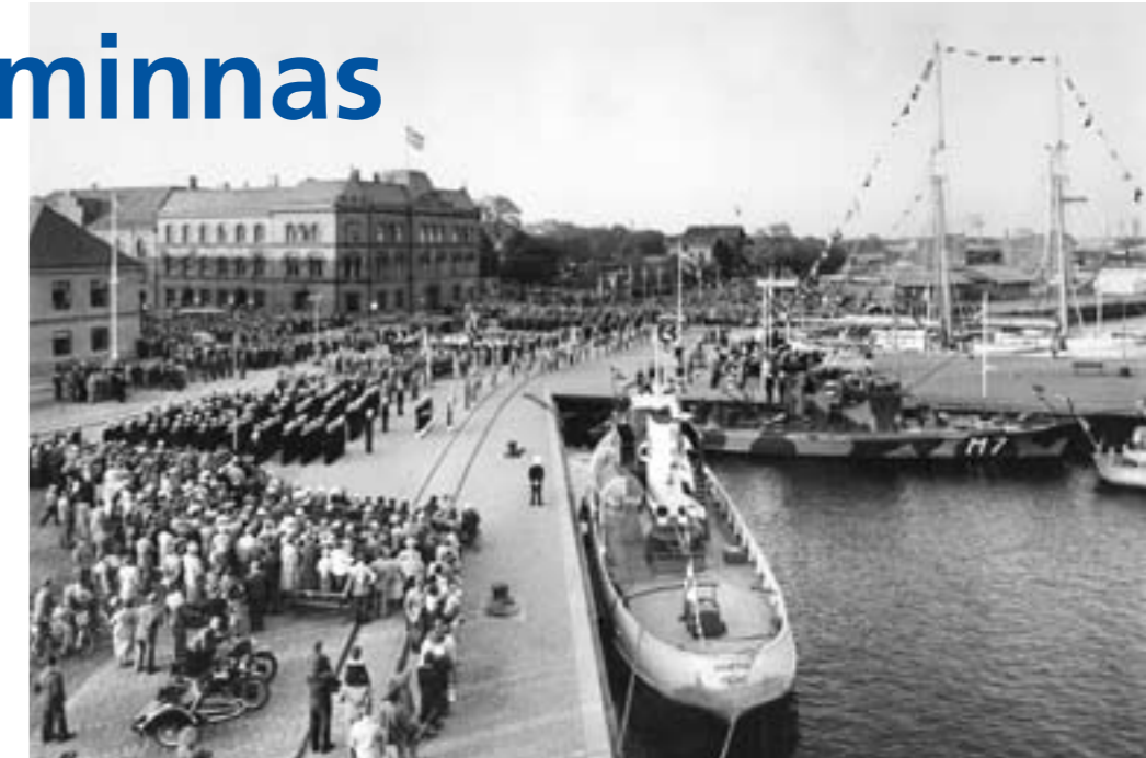
Marinfartyg tas emot med pompa och ståt 6 juni 1955 – Svenska Flaggans Dag.