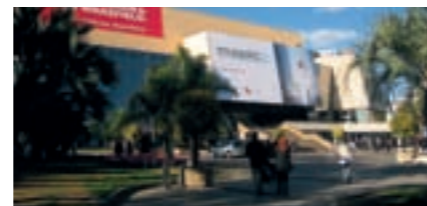
Ystads deltagande i MAPIC 2007 gav många intressanta influenser till delegaterna från kommunen och Citygruppen. En av dem var den gamla hamnstaden Genua som har utvecklat sin hamn till något av ett upplevelsecentrum.

Om det blir något konkret resultat av resan, och i så fall vad, återstår att se. Men den som reser har något att berätta. Och det räcker för att sätta fantasin i arbete.