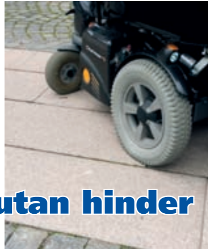
Specialslipad granit underlättar framkomligheten för rörelsehindrade.