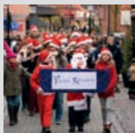
Omslaget: Kulturskolan i Ystad bjuder på Julparad.