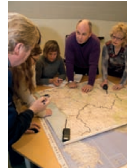
Kommunens krisledningsstab tränar regelbundet för att ha beredskap i ett krisläge.

POSOM har här en viktig uppgift genom att ge hjälp och stöd, samt sätta upp informations- och stödcentra dit människor kan söka sig, eller kon-