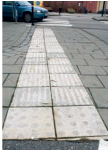
Taktila plattor i avvikande form och färg, leder synskadade på rätt väg.