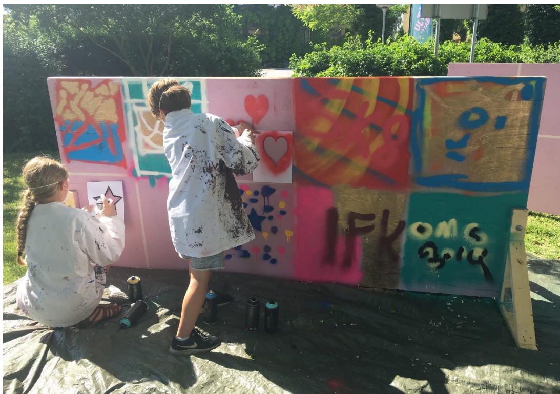
Kreativt från Ävallafestivalen