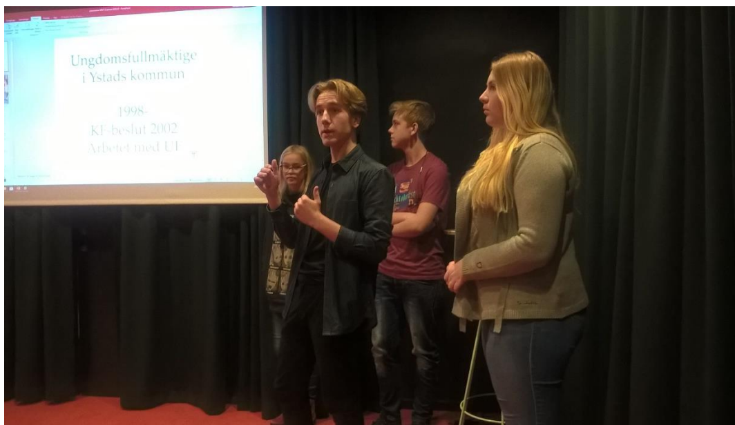
Från Presidiets presentation på KRUT i Malmö

Youth Summit 2019: Ystad ingår i ett stort projekt som Nordiska Ministerrådet har initierat till. I augusti arrangerade Sönderborg ett Youth Summit där fyra ledamöter från Ungdomsfullmäktige deltog. Syftet var att lyfta ungdomarnas inflytande och öka kunskapen om hållbar stadsutveckling med utgångspunkt i FN:s 17 globala hållbarhetsmål.