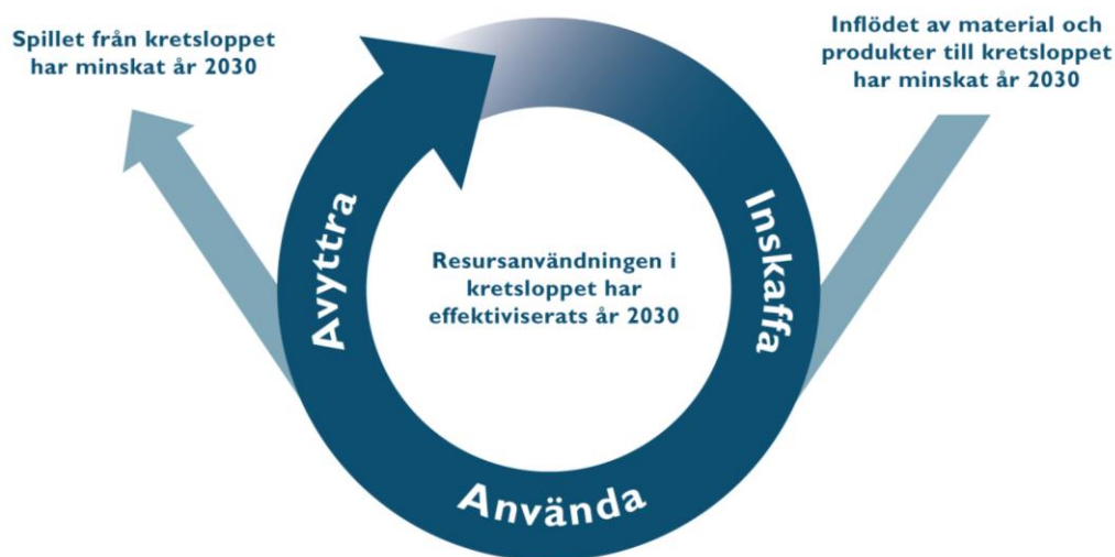
Figur 1 Tre övergripande mål har formulerats för den nya gemensamma kretsloppsplanen. Dessa fungerar också som utgångspunkt för barnkonsekvensanalysen.

För att säkerställa att barnens behov inte åsidosätts i processen med att ta fram kretsloppsplanen och genomföra tillhörande åtgärder har en barnkonsekvensanalys genomförts.