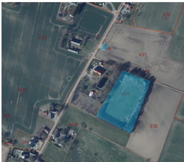
Figur 1 Blå markering visar den kommunalägda marken vid Rynge idrottsplats

I området är den största delen av marken privatägd. Kommunen äger mark vid idrottsplatsen samt en mindre fastighet i södra Sjörup.