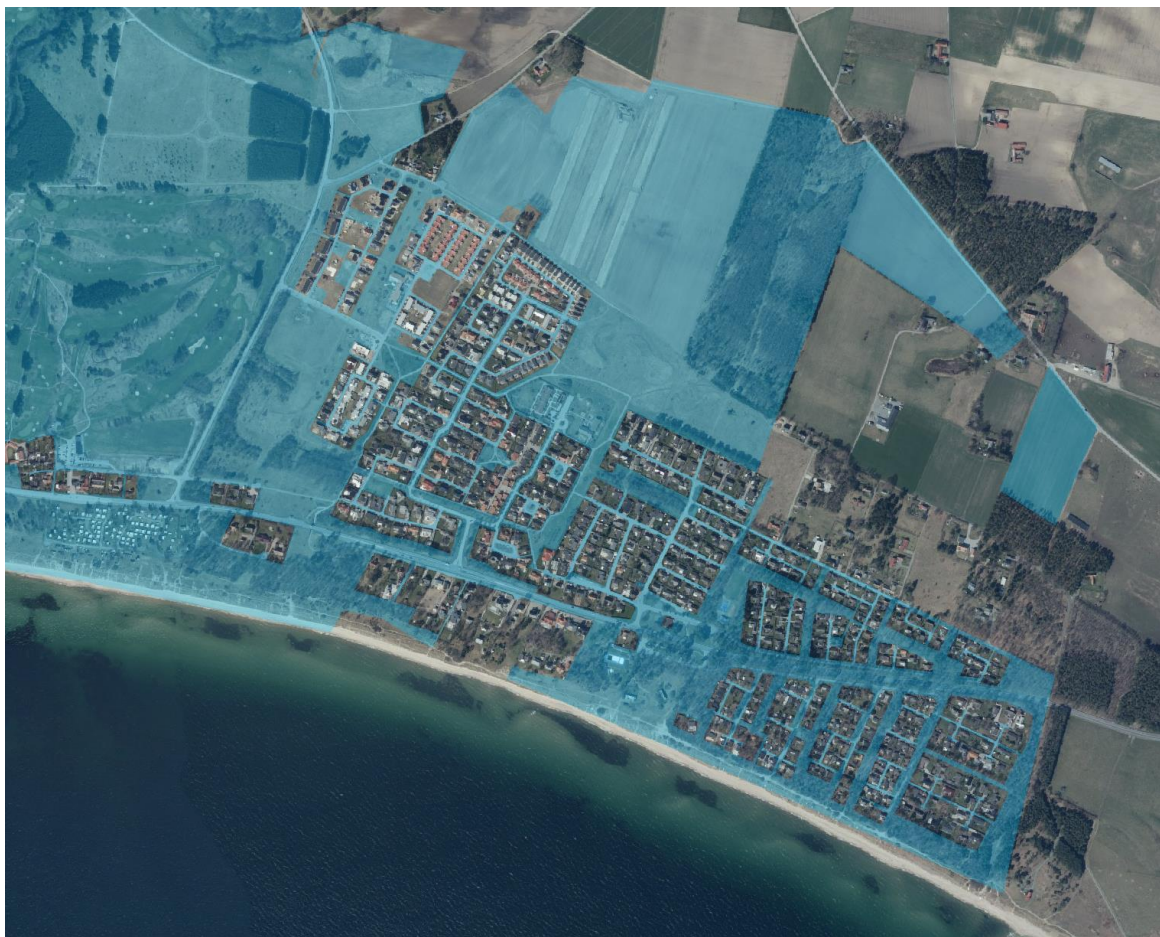
Figur 1. Blåmarkerad mark är kommunalt ägd mark