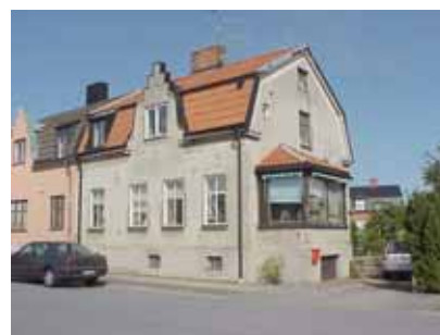
PEHRSSON 13 från SV

fastighet: PEHRSSON 13. adress: Norra Ånggatan 8. ålder: 1912. Ombyggt 1913, 1934, 1947. arkitekt / byggm: Henrik Nilsson. H. Dahlberg (1913), Åke Lindén (1947). användning: Bostad. Parhus med nr. 11. antal våningar: 2 sockel: Grå puts. väggar: Grå slätputs. tak: Mansardtak, rött 2-kupigt tegel. detaljer: Vita korsdelade och 2-lufts fönster, bruna åt söder. Mörkbrun lamelldörr med stående panel. Veranda åt söder med brun stående panel, stora hela fön- ster och valmat tegeltak. Frontespis mot väster, mjukt rundad och med trappgavel överst. Profilerad gesims. Solbänkar. Ståndränna.