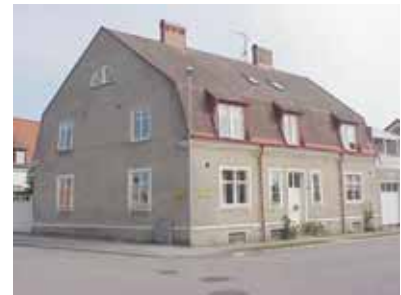
PEHRSSON 1 A från NV