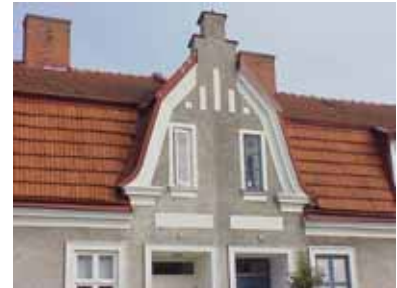
PEHRSSON 3 A och 5 A från V FRONTESPIS

fastighet: PEHRSSON 3, hus B. adress: Norra Änggatan 18. ålder: arkitekt / byggm: användning: Förråd. antal våningar: 1 sockel: väggar: Ljusgrå plåt. tak: Vålvt tak, svart papp. detaljer: Små vita hela fönster. Vita dörrar, två med runda fönster. Vita lister över skarvarna i fasadplåten. Skärmtak i vardera änden på sirliga järnkonsoler. Detta är en tågagn, som är uppställd på tomtgränsen och delas på längden med nr. 5. Ursprungligen var den inredd till torrklosett, hönshus och förråd.