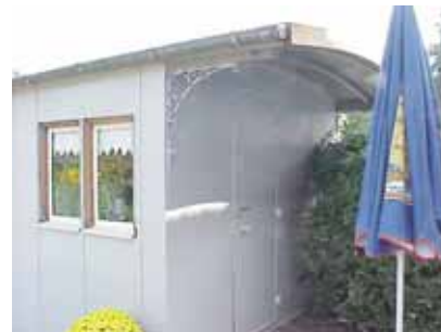
PEHRSSON 3 B från V