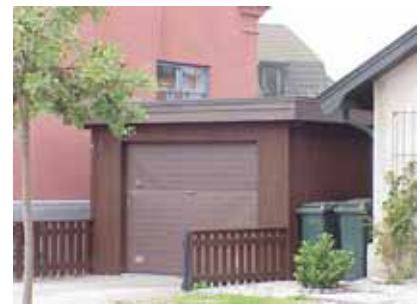
PEHRSSON 17 B från SO