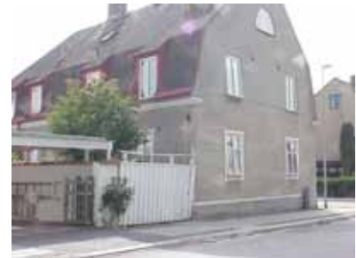
PEHRSSON 1 A från NO

fastighet: PEHRSSON 1, hus B. adress: Norra Änggatan 20. ålder: 1954. Påbyggt 1972. arkitekt / byggm: Tage Billgren. Ulf Söderman (1972). användning: Förråd, övre del bostadsdel och balkong. antal våningar: 2 sockel: Grå puts i bottenvåning, övre del vit Mexisten. väggar: Pulpettak. tak: Vita hela, småspröjsade fönster. Vit tredelad port av stående panel med överljus. Balkongräcke av vita stående brädor. detaljer: