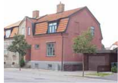
PEHRSSON 17 A från SO

K = 2, M = 2. Välbevarat parhus, ett av de äldsta i Egnahem, men med utbytta fönster och tyvärr nytt fasadmateriäl.