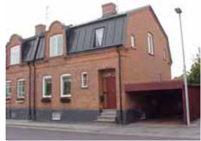
PEHRSSON 12 A från N

värdering kulturhistoriskt (K) K = 2, M = 2. miljömässigt (M) Ett välbevarat parhus, typiskt för Egnahemsområdets tidigaste tegelbebyggelse.