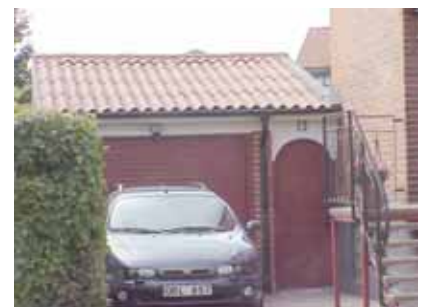
PEHRSSON 14 B från NO