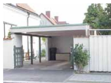
PEHRSSON 2 B från NV