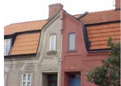
PEHRSSON 16 och 17 A från SO FRONTESPIS