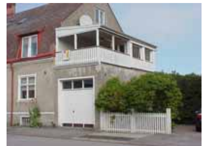
PEHRSSON 1 B från SV