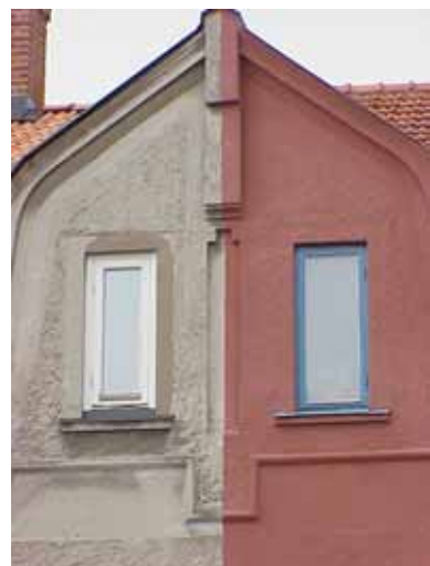
PEHRSSON 16 och 17 A från SO FRONTESPISDEKOR