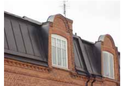
PEHRSSON 14 A från SO FRONTESPIS