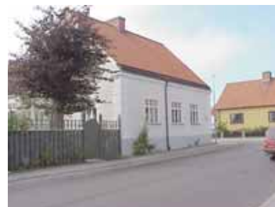
PEHRSSON 2 A från SO