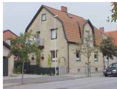
PEHRSSON 18 A från S