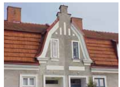
PEHRSSON 3 A och 5 A från V FRONTESPIS

värdering kulturhistoriskt (K) miljömässigt (M) K = 1, M = 2. Ett välbevarat parhus, typiskt för Egnahemsområdets tidigaste bebyggelse.