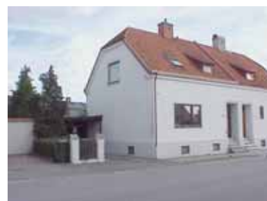
PEHRSSON 7 A från NV

fastighet: PEHRSSON 7, hus A. adress: Norra Änggatan 14. ålder: 1911. Ombyggt 1933, 1970. arkitekt / byggm: Henrik Nilsson. Allm. Ingenjörbyrå (1970). användning: Bostad. Parhus med nr. 9. antal våningar: 1½ sockel: Ljust gråmålad puts. väggar: Vit spritputs. tak: Halvvalmat sadeltak, rött 1-kupigt tegel. detaljer: Bruna hela och 3-lufts fönster. Brun teakdörr med kvadratmönster och sido- och överljus. Liten kupa mot väster med tegeltak, klädd med röd falsad plåt. Profilerad gesims och dörrromfattning i slätputs. Utkragande slätputsade fönsteromfattningar. Ståndränna.