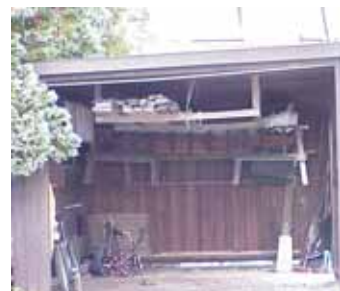
PEHRSSON 7 B från V

fastighet: PEHRSSON 7, hus B. adress: Norra Änggatan 14. ålder: arkitekt / byggm: användning: Carport. antal våningar: 1 sockel: väggar: Brun lockpanel. tak: Pulpettak, trapetsplåt. detaljer: