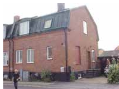
PEHRSSON 8 A från NO

värdering kulturhistoriskt (K) miljömässigt (M) K = 3, M = 3.