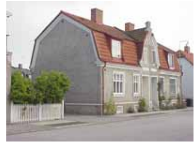
PEHRSSON 3 A från NV

K = 1, M = 2. Ett välbevarat parhus, typiskt för Egnahemsområdets tidigaste bebyggelse.