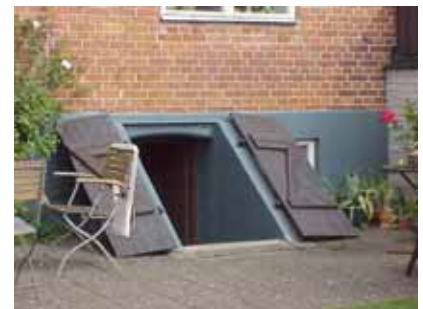
PEHRSSON 14 A från V KÄLLARNEDGÅNG

fastighet: PEHRSSON 14, hus B. adress: Skolgatan 19. ålder: arkitekt / byggm: användning: Garage. antal våningar: 1 sockel: väggar: Rött tegel. tak: Sadeltak, röd korrugerad eternit(?). detaljer: Brun garageport med liggande panel. Brunröd rundad port, med panel i fiskbensmönster, till trädgård.