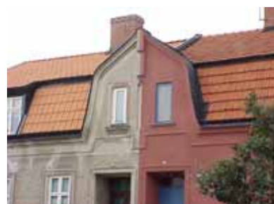
PEHRSSON 16 och 17 A från SO FRONTESPIS