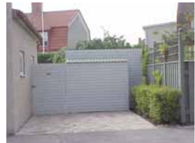
PEHRSSON 4 C från NO

fastighet: PEHRSSON 4, hus C. adress: ålder: arkitekt / byggm: användning: Förråd. antal våningar: 1 sockel: väggar: Vit liggande fjällpanel. tak: Pulpettak, ljusgrön trapetsplåt. detaljer: