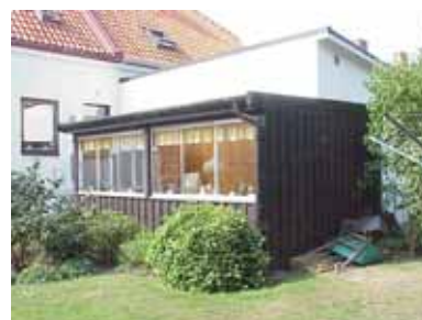
PEHRSSON 9 B från SO