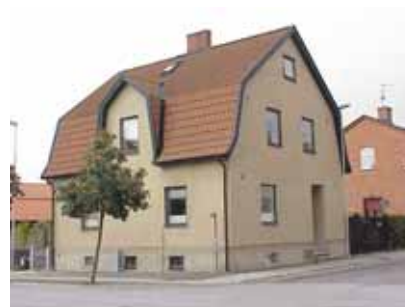
PEHRSSON 18 A från SO

fastighet: PEHRSSON 18, hus B. adress: Bruksgatan 6. ålder: 1955. arkitekt / byggm: Börje Johnzon. användning: Garage, förråd. antal våningar: 1 sockel: Ljusbeige puts. väggar: Beige slätputs. tak: Sadeltak, röd betongpanna. detaljer: Bruna små hela fönster. Grågrön garageport av plåt med mönster av liggande ränder. Brun teakdörr med fönster och stående panel.