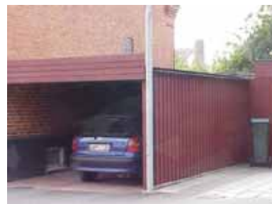
PEHRSSON 12 B från NO

fastighet: PEHRSSON 12, hus B. adress: Skolgatan 21. ålder: 1978. arkitekt / byggm: användning: Carport, förråd. antal våningar: 1 sockel: väggar: Brun lockpanel. tak: Platt tak, svart trapetsplåt. detaljer: Mörkbrun dörr i stående panel. Takkant i röd lig- gande fjällpanel.