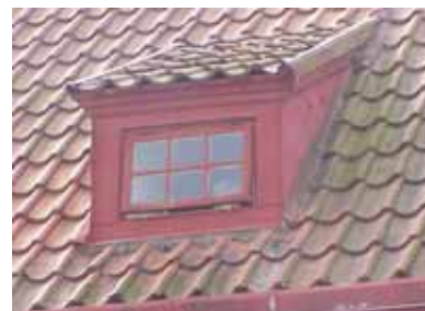
PEHRSSON 4 A från NO KUPA