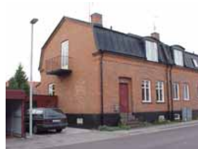
PEHRSSON 10 A från O

fastighet: PEHRSSON 10, hus A. adress: Skolgatan 23. ålder: 1911. Ombyggt 1952. arkitekt / byggm: E. Olsson. Bertil Sandin (1952). användning: Bostad. Parhus med nr. 8. antal våningar: 2 sockel: Svartmålad puts. väggar: Rött tegel. tak: Mansardtak, svart falsad plåt. detaljer: Vita korsdelade fönster. Röd lamelldörr med mönster av stående panel. Farstu i tegel mot väster. Avtrappad gesims. Ståndränna. Stickbågar. Balkong åt söder med svart järnräcke.