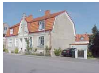
PEHRSSON 5 A från SV

fastighet: PEHRSSON 5, hus A. adress: Norra Änggatan 16. ålder: 1911. Ombyggt 1952. arkitekt / byggm: Henrik Nilsson. Bertil Sandin (1952). användning: Bostad. Parhus med nr. 3. antal våningar: 2 sockel: Grå stänkputs. väggar: Grå spritputs. tak: Mansardtak, rött flattegel. detaljer: Blå 2- och 3-lufts fönster med överbåge. Blå lamelldörr med spegelmönster, halvrunn spröjsat fönster och överljus. Frontespis, delad med nr. 3, krönt av trappgavel, med vita dekorpartier i slätputs, vit fönsteromfattning och profilerad vit gesims. Vita profilerade dörr- och fönsteromfattningar i bottenvåningen. Solbänkar. Profilerad vit gesims och vit sockelkant. Stådränna.