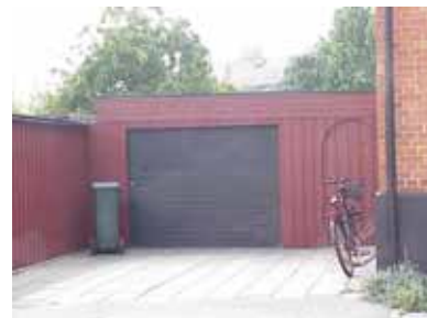
PEHRSSON 10 B från NO

fastighet: PEHRSSON 10, hus B. adress: Skolgatan 23. ålder: arkitekt / byggm: användning: Garage, förråd. antal våningar: 1 sockel: väggar: Röd lockpanel. tak: Platt tak, svart trapetsplåt. detaljer: Svart garageport i plåt med mönster av liggande panel. Röd dörr av stående panel.