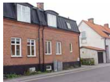
PEHRSSON 8 A från SO

fastighet: PEHRSSON 8, hus B. adress: Skolgatan 25. ålder: 1972. arkitekt / byggm: Erik Svensson. användning: Garage, förråd. antal våningar: 1 sockel: väggar: Rött tegel. tak: Sadeltak, svart korrugerad eternit. detaljer: Svart lamelldörr med stående panel. Svart garageport med liggande panel.