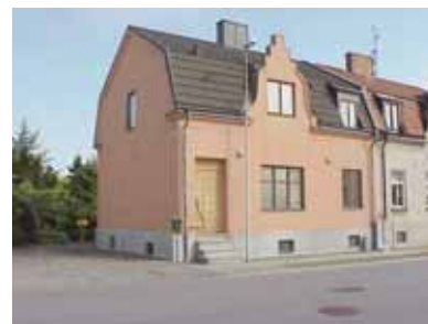
PEHRSSON 11 A från NV

fastighet: PEHRSSON 11, hus A. adress: Norra Ånggatan 10. ålder: 1912. Ombyggt 1926, 1934, 1962. arkitekt / byggm: Henrik Nilsson (även 1926). S. Persson (1934), R. Malm (1962). användning: Bostad. Parhus med nr. 13. antal våningar: 2 sockel: Ljust gråmålad puts. väggar: Aprikosmålad puts. tak: Mansardtak, mörkgrå tegelimiterande lättbetongplattor. detaljer: Brunna 2- och 3-lufts fönster, med överbåge på bottenvåningen. Ljusbrun klarlackerad lamell dörr med kvadratmönster. Frontespis mot väster, mjukt rundad och med trappgavel överst. Profilerad gesims. Ståndränna. Stuprör av koppar. värdering kulturhistoriskt (K) miljömässigt (M) K = 1, M = 2. Ett välbevarat parhus, typiskt för Egnahemsområdets tidigaste bebyggelse.