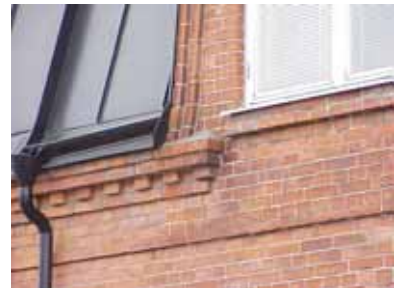
PEHRSSON 12 A från NO GESIMS