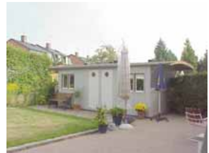
PEHRSSON 3 B från NV

K = 1, M = 1. En unik "förrådsbyggnad". Järnvägsanställda utgjorde en stor andel av de första innevärdarna i Egnahem, troligen kom den till då.