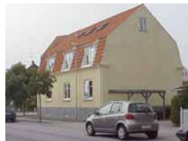
PEHRSSON 15 A från O

fastighet: PEHRSSON 15, hus B. adress: Bruksgatan 12. ålder: arkitekt / byggm: användning: Förråd, soprum. antal våningar: 1 sockel: väggar: Vit stående panel. tak: Sadeltak, svart papp. detaljer: Vita dörrar med stående panel.