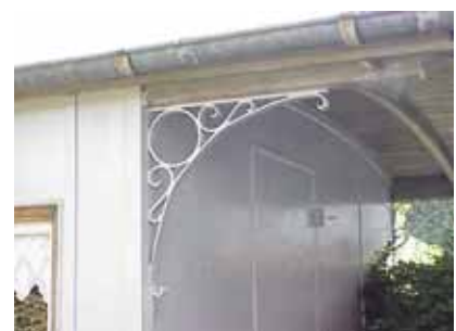
PEHRSSON 3 B från NV KONSOL