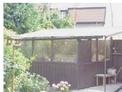
PEHRSSON 11 B från NV

fastighet: PEHRSSON 11, hus B. adress: Norra Ånggatan 10. ålder: arkitekt / byggm: användning: Uterum. antal våningar: 1 sockel: väggar: Brun lockpanel. tak: Pulpettak, korrugerad plast. detaljer: Brunna hela fönster. Brun dörr av stående panel. värdering kulturhistoriskt (K) miljömässigt (M) K = 5, M = 4.