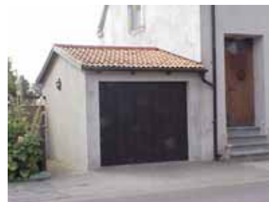
PEHRSSON 6 B från O

fastighet: PEHRSSON 6, hus B. adress: Skolgatan 27. ålder: 1962. arkitekt / byggm: K. Ericsson. användning: Garage. antal våningar: 1 sockel: väggar: Grå puts. tak: Sadeltak, rött 2-kupigt tegel. detaljer: Mörkbrun garageport med mönster av stående ribbor.