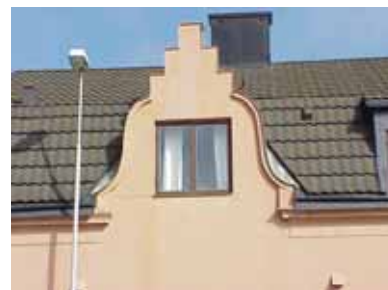
PEHRSSON 11 A från SV FRONTESPIS

fastighet: PEHRSSON 11, hus B. adress: Norra Ånggatan 10. ålder: arkitekt / byggm: användning: Uterum. antal våningar: 1 sockel: väggar: Brun lockpanel. tak: Pulpettak, korrugerad plast. detaljer: Brunna hela fönster. Brun dörr av stående panel. värdering kulturhistoriskt (K) miljömässigt (M) K = 5, M = 4.