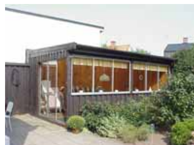
PEHRSSON 9 B från SV