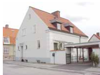
PEHRSSON 2 A från NV