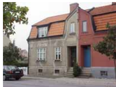
PEHRSSON 16 från SO

värdering kulturhistoriskt (K) K = 1, M = 2. miljömässigt (M) Mycket välbevarat parhus, ett av de äldsta i Egnahem.