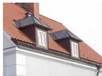
PEHRSSON 2 A från NV KUPOR

fastighet: PEHRSSON 2, hus B. adress: Vassgatan 5. ålder: 1980. Ombyggt 2001. arkitekt / byggm: Lolle Lundqvist (2001). användning: Carport, förråd. antal våningar: 1 sockel: Vit puts. väggar: Vit puts. tak: Lågt valmat sadeltak, ljusgrön falsad plåt. detaljer: