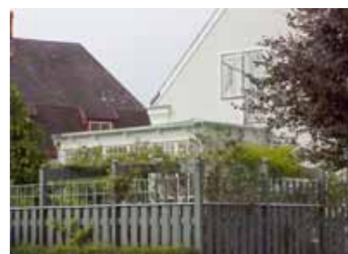
PEHRSSON 2 A från SO UTERUM