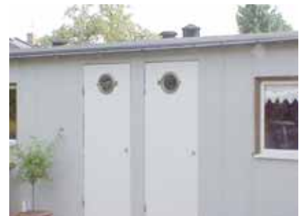
PEHRSSON 3 B från NV DÖRRAR