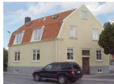
PEHRSSON 15 A från SV