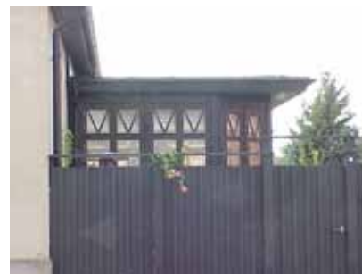
PEHRSSON 18 C från NO

värdering kulturhistoriskt (K) miljömässigt (M) K = 4, M = 4.