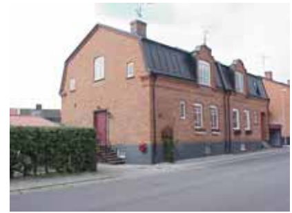
PEHRSSON 14 A från SO

K = 2, M = 2. Ett välbevarat parhus, typiskt för Egnahemsområdets tidigaste tegelbebyggelse.