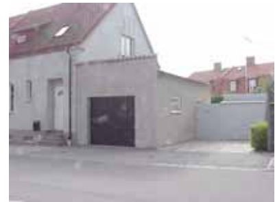
PEHRSSON 4 B från NO

fastighet: PEHRSSON 4, hus B. adress: Skolgatan 29. ålder: arkitekt / byggm: användning: Garage. antal våningar: 1 sockel: väggar: Grå puts. tak: Platt tak. detaljer: Vita hela fönster. Brun garageport med mönster av stående ribbor. Taktegelkrönt mur ovanför porten.