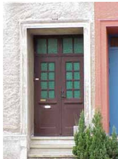
PEHRSSON 16 från SO DÖRR