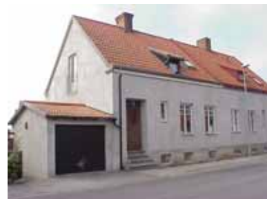
PEHRSSON 6 A från O

värdering kulturhistoriskt (K) miljömässigt (M) K = 3, M = 3.