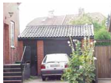
PEHRSSON 8 B från NO

värdering kulturhistoriskt (K) miljömässigt (M) K = 5, M = 4.