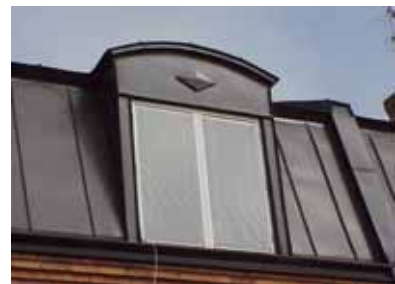
PEHRSSON 12 A från SO MANSARD