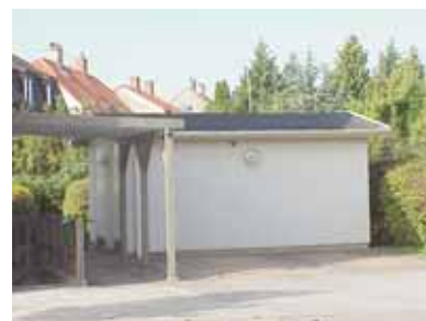
PEHRSSON 15 B från SO