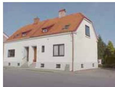
PEHRSSON 9 A från SV

fastighet: PEHRSSON 9, hus B. adress: Norra Änggatan 12. ålder: arkitekt / byggm: användning: Uterum. antal våningar: 1 sockel: väggar: Brun lockpanel. tak: Pulpettak, korrugerad plåt. detaljer: Vita hela fönster. Glasad skjutdörr.