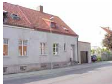
PEHRSSON 4 A från O