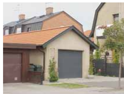
PEHRSSON 18 B från S