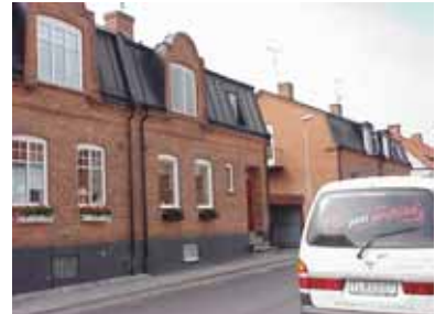
PEHRSSON 12 A från SO