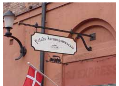
EDVH 2:61 A från N SKYLTT 2