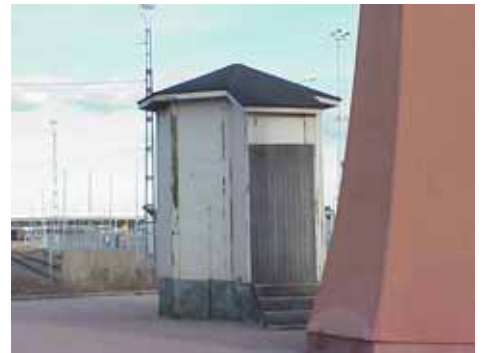
HAMNEN 2:3 B från NV