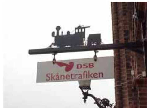
EDVH 2:61 A från S SKYLTT 3