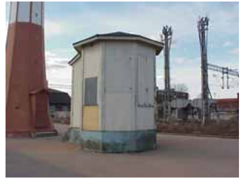
HAMNEN 2:3 B från SO

värdering kulturhistoriskt (K) K = 1, M = 1. miljömässigt (M): Behöver ytterligare renovering, en del är gjort.