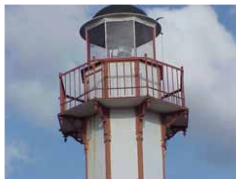
HAMNEN 2:3 A från SV ÖVRE