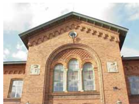
EDVH 2:61 A från S RISALIT