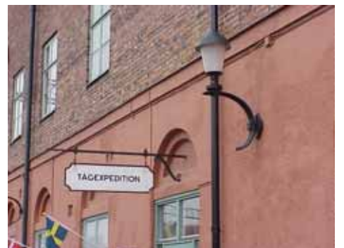
EDVH 2:61 A från N SKYLTT 1