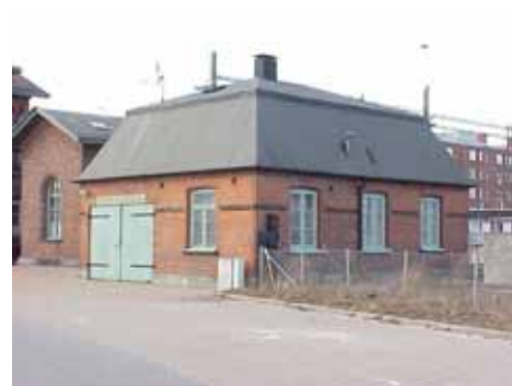
EDVH 2:61 D från SO

värdering K = 2, M = 1. kulturhistoriskt (K) miljömässigt (M):