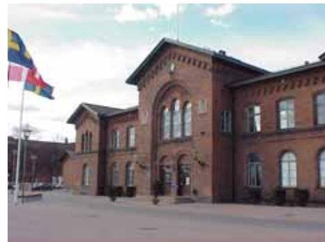
EDVH 2:61 A från SO

värdering K = 1, M = 1. kulturhistoriskt (K) miljömässigt (M):