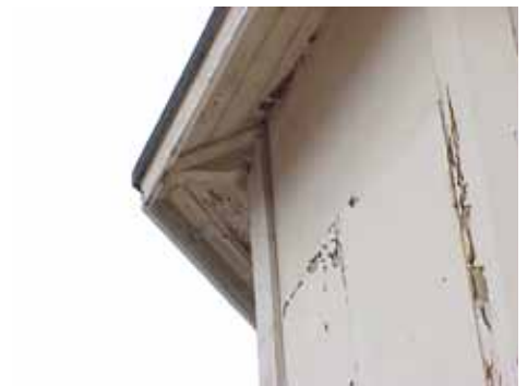
HAMNEN 2:3 B från N TAKKANT