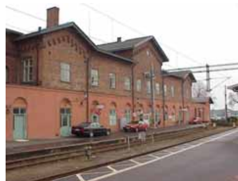
EDVH 2:61 A från NO