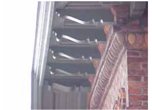
EDVH 2:61 A från S KNEKTAR