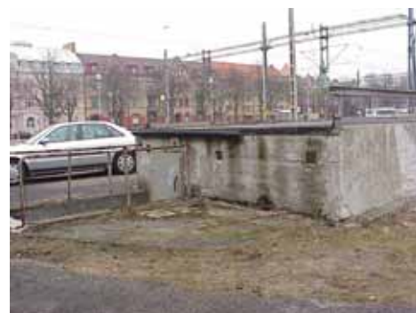
EDVH 2:2 från S

värdering K = 5, M = 5. kulturhistoriskt (K) miljömässigt (M):