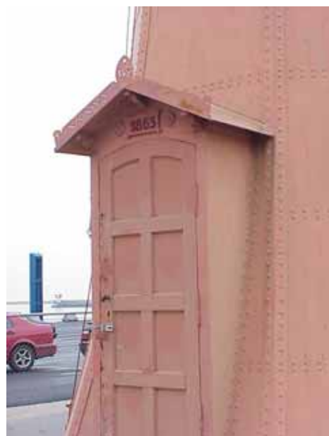
HAMNEN 2:3 A från NO INGÅNG