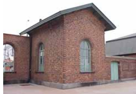
EDVH 2:61 B från SO

värdering K = 1, M = 1. kulturhistoriskt (K) miljömässigt (M):