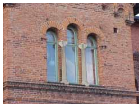
EDVH 2:61 A från SV FÖNSTER Ö DELEN