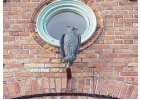
EDVH 2:61 A från S UGLA