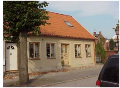
KEMNER 7 från SO