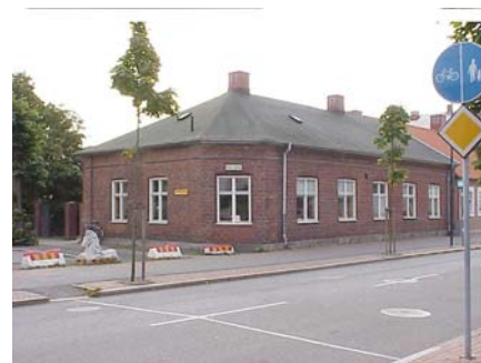
KEMNER 1 B från NV