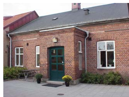
KEMNER 1 B från NO FARSTU