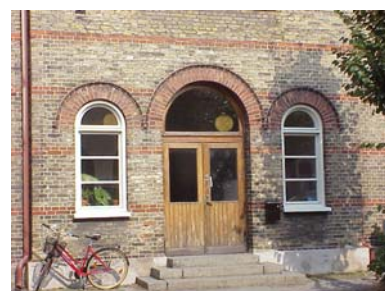
KEMNER 1 A från S ENTRÉPARTI