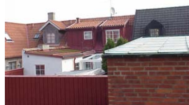
KEMNER 5 från SV