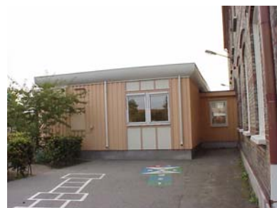
KEMNER 1 E från V

fastighet: KEMNER 5. adress: Sektorsgatan 16. ålder: Ombyggt 1929, 1937, 1953. arkitekt / byggm: G. Schultz (1929), Johan Schultz (1953). användning: Bostad. antal våningar: 1½ sockel: Gråmålad puts. väggar: Ljusgrå puts. tak: Sadeltak, rött 1-kupigt tegel. detaljer: Vita hela fönster, olika storlekar, med lösa spröjsar. Vit lamelldörr med spegelmönster och halvrunt fönster. Dörromfattning av mörkbrun klinker. Mörkröd enkel takfot. Yttertrappa med kalksten och gul klinker. Ståndränna. Två kupor mot väster, klädda med röd plåt.