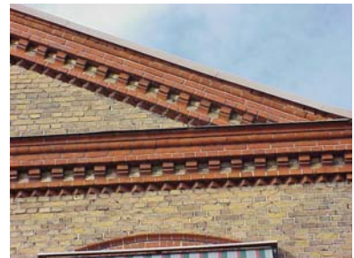
KEMNER 1 A från O GESIMS