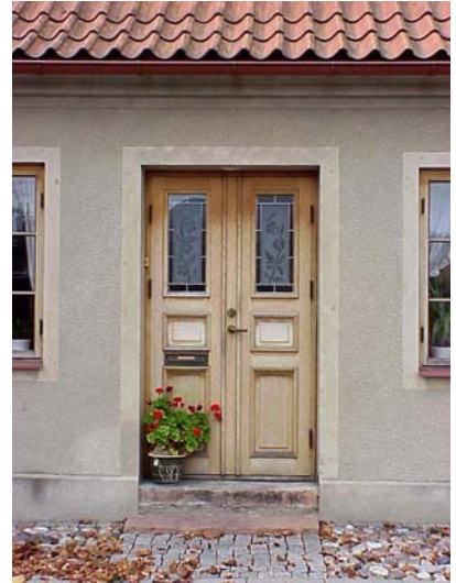
KEMNER 7 från O DÖRR