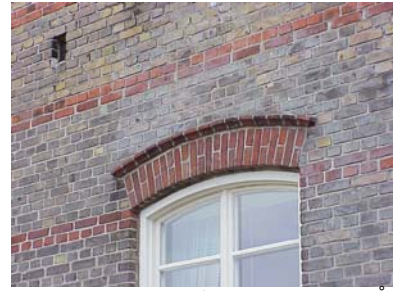
KEMNER 1 A från SV STICKBÅGE