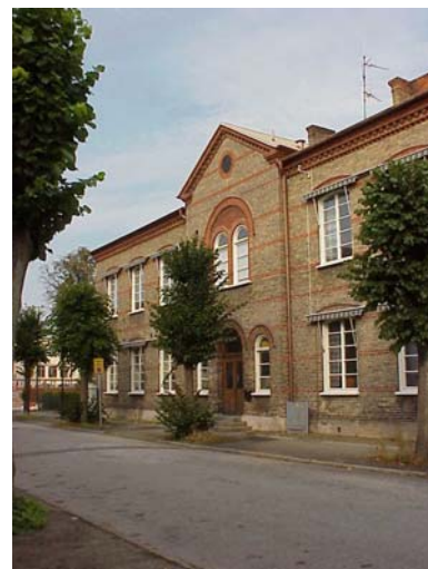
KEMNER 1 A från SO

värdering kulturhistoriskt (K) miljömässigt (M) K =1, M =1. De två, tyvärr nödvändiga, brandtrapporna skämmer huset.