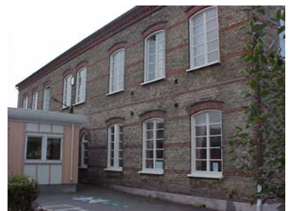
KEMNER 1 A från NV