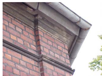
KEMNER 1 B från NO TAKFOT

fastighet: KEMNER 1, hus C. adress: Jennygatan 5. ålder: 1993. arkitekt / byggm: Nilsson & Persson. användning: Skolmatsal. antal våningar: 1 sockel: Grå betong. väggar: Gult tegel. tak: Sadeltak, rött 2-kupigt tegel. detaljer: Vita hela fönster, några med överbåge. Vitt spröjsat 2-lufts fönster i gavelspets mot söder. Vit glasad ramdörr. Breda fönsteromfattningar i vit puts. Avtrappad gesims. Röd plåt i gavelspets mot norr. Utskjutande farstu med valmat tak i svart papp och avtrappad gesims.