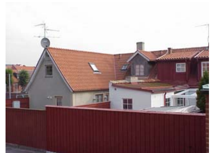
KEMNER 7 från SV