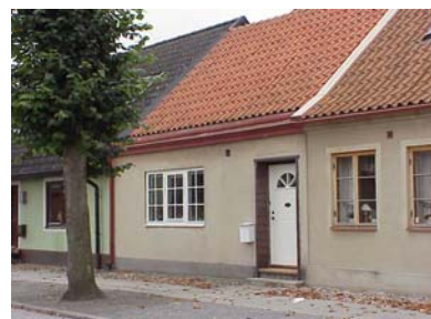
KEMNER 5 från NO