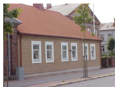
KEMNER 1 C från NV