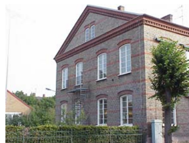
KEMNER 1 A från SV