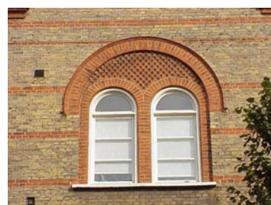
KEMNER 1 A från S FÖNSTERPARTI