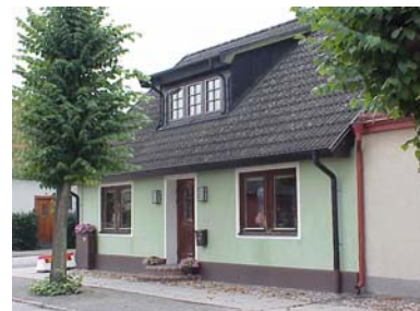
KEMNER 6 A från NO

fastighet: KEMNER 6, hus B. adress: Tobaksgatan 15. ålder: 1932 (norra delen). Ombyggt 1956. arkitekt / byggm: Curt Sjöholm (1956). användning: Garage, förråd. antal våningar: 1 sockel: Grönmålad puts. väggar: Grönmålad puts. tak: Pulpettak, svart papp. detaljer: Brun garageport med stående panel. I muren brun rundad port med stående panel och svarta hängslor med blommor, hängslorna tagna från dörr på Regementet. Vita dörrromfattningar.