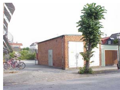
KEMNER 1 D från SV

fastighet: KEMNER 1, hus E. adress: Tobaksgatan 13. ålder: arkitekt / byggm: användning: Skolsal. antal våningar: 1 sockel: Grå betong. väggar: Gulröd stående lockpanel. tak: Platt tak. detaljer: Hela aluminiumfönster. Vita glasade ramdörrar. Kraftigt vitt rundat takutsprång. Gråvita skivor med gulröda lister över och under fönster.