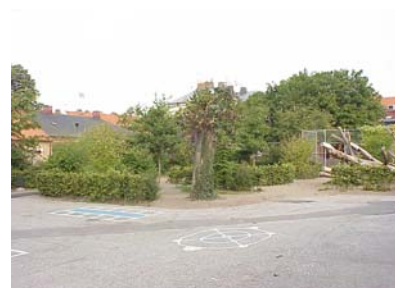
KEMNER 1 från S SKOLGÅRD