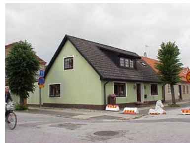
KEMNER 6 A från SO