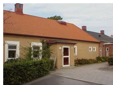
KEMNER 1 C från SO