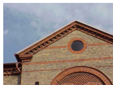
KEMNER 1 A från S GAVELSPETS