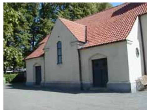
KAPELLET från S