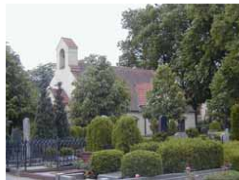
KAPELLET från NO