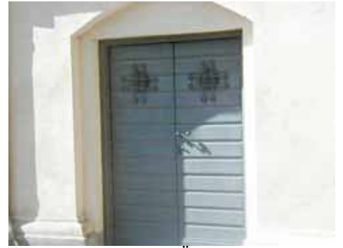
KAPELLET från N DÖRR