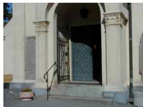
KAPELLET från O INGÅNG