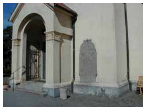
KAPELLET från O PORTAL