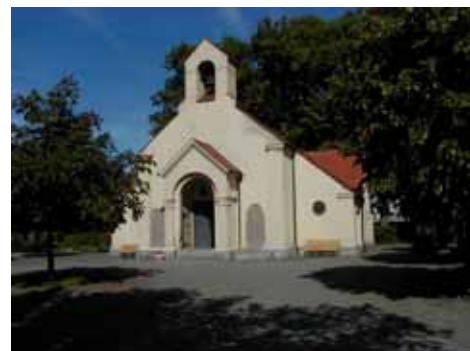
KAPELLET från O