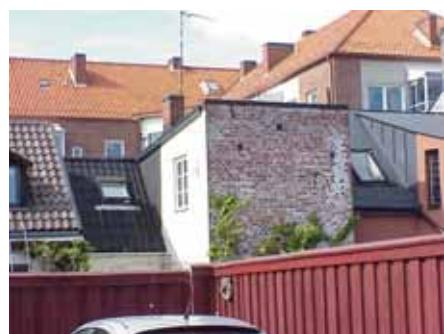
BRIGITTA 7 från S