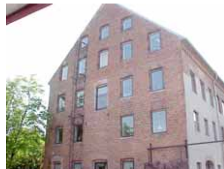
BRIGITTA 34 A från NV