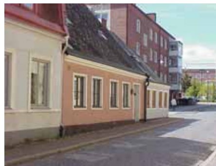
BRIGITTA 12 från SO

fastighet: BRIGITTA 15. adress: Norra Vallgatan 78. ålder: 1800-tal. Ombyggt 1919. arkitekt / byggm: Henrik Nilsson (1919). användning: Bostad. antal våningar: 1 sockel: Mörkgrå cementputs. väggar: Vitmålad spritputs. tak: Sadeltak, svagt utböjt, grå eternit. detaljer: Blått 3-luftsfönster med spröjsade överbågar. Blå glasad pardörr med speglar. Vit profilerad gesims. Ståndränna.