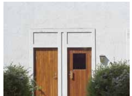
BRIGITTA 27 från NO DÖRRAR