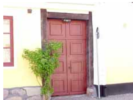
BRIGITTA 31 från O PORT

fastighet: BRIGITTA 32. adress: Klostergatan 17. ålder: 1800-tal. Ombyggt 1947, 1978. arkitekt / byggm: Nils Selander (1947), Tomas Lasson (1978). användning: Bostad. antal våningar: 2 sockel: Grå cementputs. väggar: Vit cementputs. tak: Sadeltak, rött 2-kupigt tegel. detaljer: Gröna 2-lufts spröjsade fönster, åt gård vita. Brun teakdörr. Profilerad vit gesims. Yttertrappa med klinker.