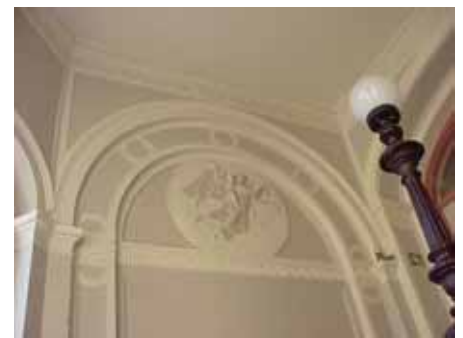
BRIGITTA 33 A TRAPPHUSDE- KOR