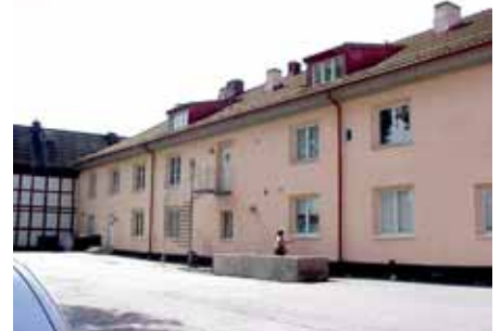
BRIGITTA 29 från NO