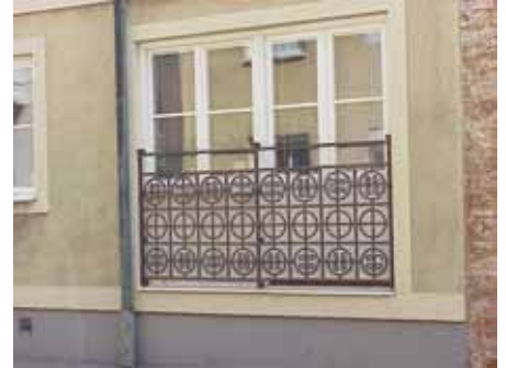
BRIGITTA 27 från SV GALLER