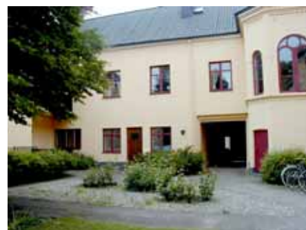
BRIGITTA 33 A från NO