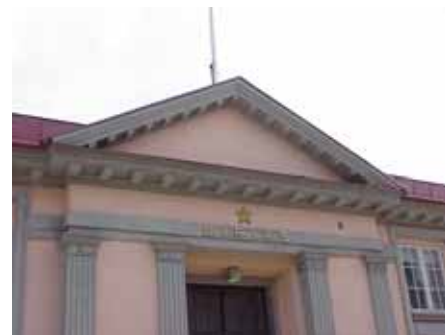
BRIGITTA 29 från V FRONTESPIS