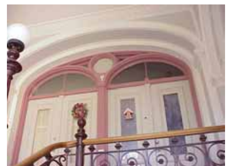
BRIGITTA 33 A TRAPPHUS DÖRRUMFATTNING