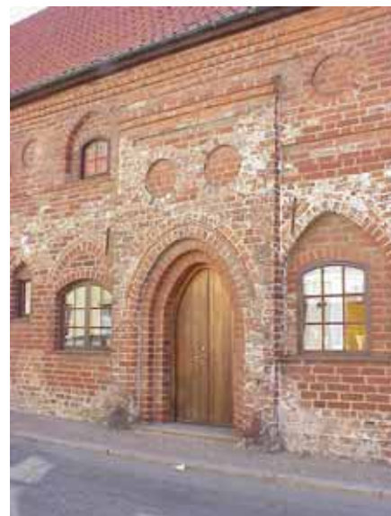
BRIGITTA 35 A från SV PORTAL