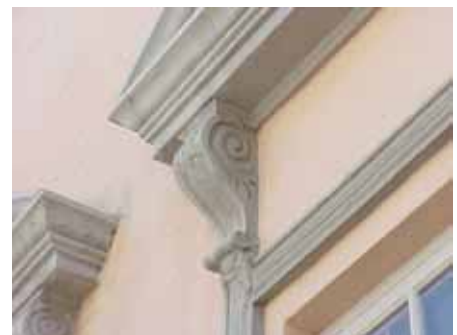
BRIGITTA 29 från N KONSOL