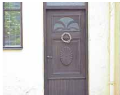
BRIGITTA 6 från N DÖRR

fastighet: BRIGITTA 7. adress: Norra Vallgatan 72. ålder: 1800-tal. Ombyggt 1928. arkitekt / byggm: Bostad. användning: Bostad. antal våningar: 1, mot gård 2 i halva huset. sockel: Svartmålad cementputs. väggar: Röd cementputs, åt gård gulvit. tak: Sadeltak och pulpettak, grå profilplåt och slätplåt. detaljer: Vita spröjsade 2-lufts fönster. Blå pardörr med speglar och överljus. Profilerad vit gesims. Ståndränna.