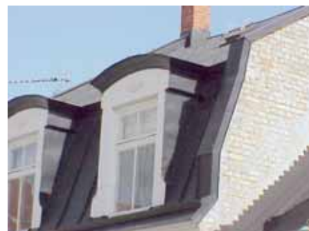
BRIGITTA 11 från NV MANSARD