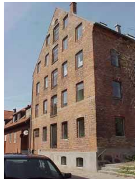
BRIGITTA 34 A från O