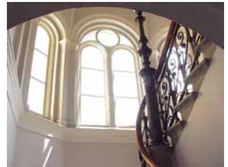
BRIGITTA 33 A TRAPPHUS