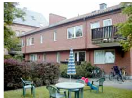
BRIGITTA 35 B från NV

fastighet: BRIGITTA 37. adress: Norra Vallgatan 66-68. ålder: 1800-tal. Ombyggt 1921, 1927, 1931, 1946. arkitekt / byggm: Henrik Nilsson (1921 och 1927), Tage Billgren (1946). användning: Bostad. antal våningar: 2, mansard åt gata. sockel: Grå cementputs. väggar: Vit spritputs. tak: Mansardtak med röd eternit, i övrigt ljusgrå plåt. detaljer: Blågrå 2- och 3-lufts fönster. Glasad blågrå ramdörr. Profilerad gesims. Ståndränna. Gårdshus med vit stående träpanel och pulpettak i svart papp.