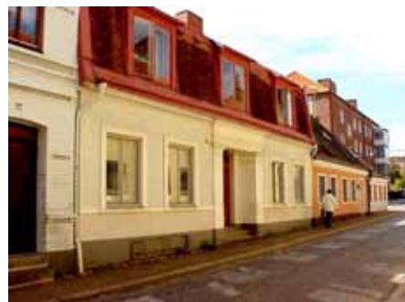
BRIGITTA 16 från SO