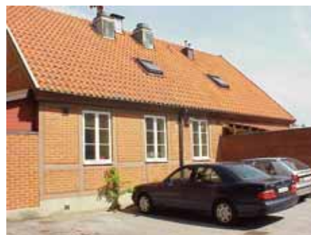
BRIGITTA 33 C från S

fastighet: BRIGITTA 33, hus D. adress: Stora Norregatan 18. ålder: 1800-tal. Ombyggt 1928, 1972. arkitekt / byggm: Henrik Nilsson (1928), Rune Welin (1972). användning: Bostäder. antal våningar: 2 sockel: Gråmålad puts. väggar: Gul slätputs, åt norr korsvirke med röd timra och vitslammat tegel i facken. tak: Sadeltak, korrugerad svart eternit. detaljer: Röda spröjsade 1- och 2-lufts fönster. Röd glasad spegeldörr med spröjsat överljus. Röd lock-panel på gavelspets.