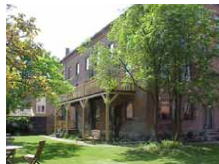
BRIGITTA 34 A från NO