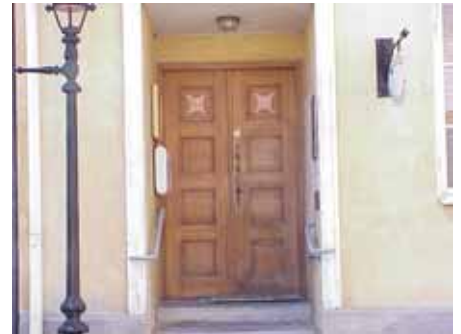
BRIGITTA 21 från O DÖRR