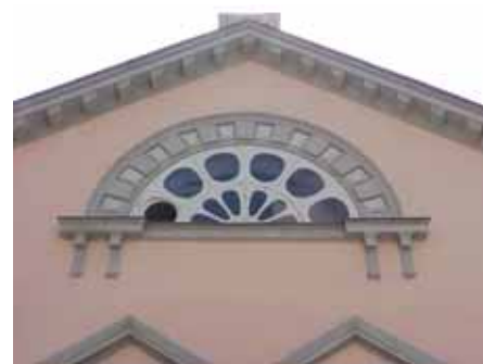
BRIGITTA 29 från N LUNETT-FÖNSTER