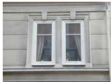
BRIGITTA 33 A från SV FÖNSTER