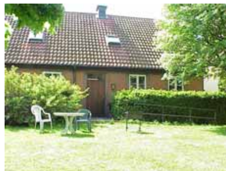
BRIGITTA 33 C från N

värdering kultuhistoriskt (K) miljömässigt (M): K = 4, M = 2.