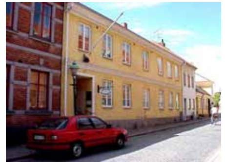
BRIGITTA 21 från SO

värdering kulturhistoriskt (K) miljömässigt (M): K = 2(gata) 4(gård), M = 2. Gatusidan är välbevarad, men gårdssidan har en mängd påklitrade tillägg, i form av trappor och balkonger.