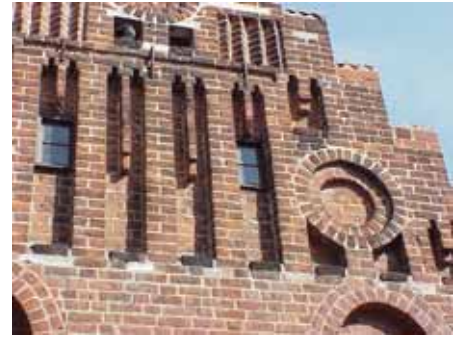
BRIGITTA 35 A från S BLINDE- RING