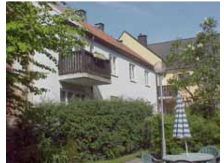
BRIGITTA 27 från SO