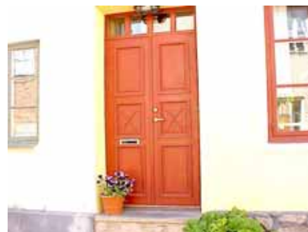
BRIGITTA 31 från O DÖRR