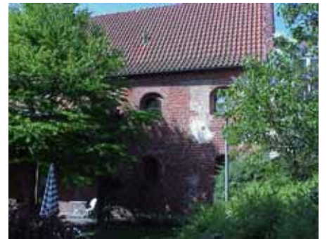
BRIGITTA 35 A från O