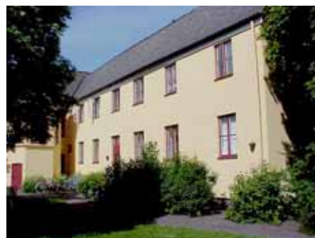
BRIGITTA 33 D från Ö

värdering kultuhistoriskt (K) miljömässigt (M): K = 2, M = 2.