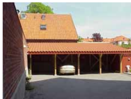
BRIGITTA 34 CARPORT från S