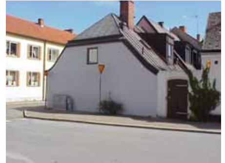
BRIGITTA 38 från NV