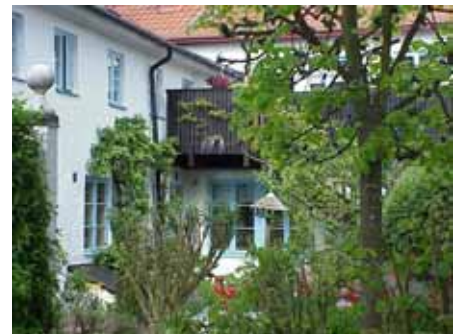
BRIGITTA 21 från V