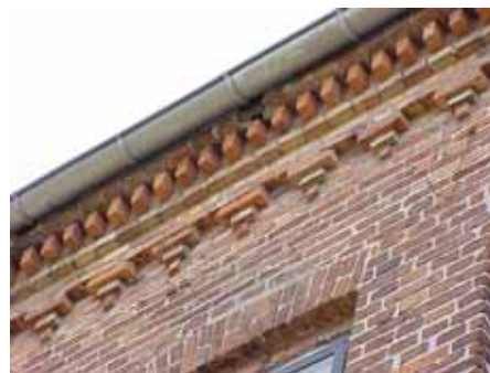
BRIGITTA 34 A från SV GESIMS