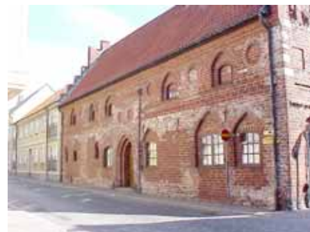
BRIGITTA 35 A från SV

värdering kulturhistoriskt (K) K = 1, M = 1. miljömässigt (M): Byggnaden är förklarad som byggnadsminne.