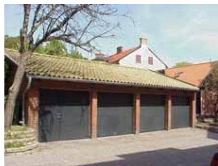
BRIGITTA 34 B från SV