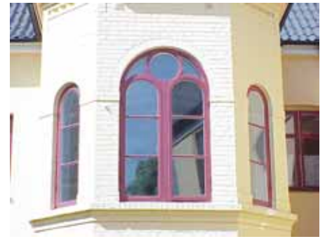
BRIGITTA 33 A från NO TRAPP- FÖNSTER