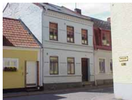
BRIGITTA 17 från SO