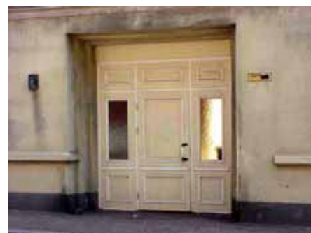
BRIGITTA 33 A från SV PORT