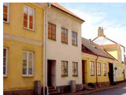
BRIGITTA 32 från SO

värdering K = 4, M = 3. kulturhistoriskt (K) miljömässigt (M):