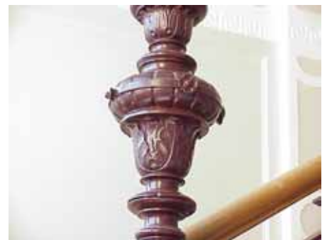
BRIGITTA 33 A TRAPPHUS LAMPDETALJ