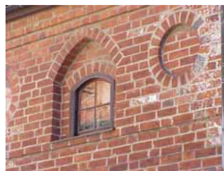
BRIGITTA 35 A från SV FÖNSTER