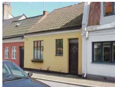
BRIGITTA 6 från NV