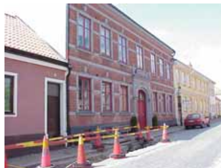
BRIGITTA 22 från SO