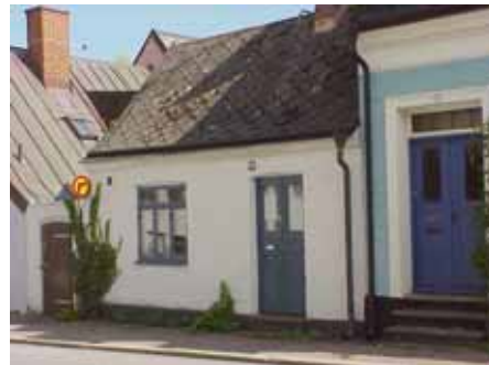
BRIGITTA 15 från NV