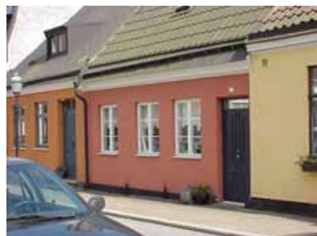
BRIGITTA 7 från NV