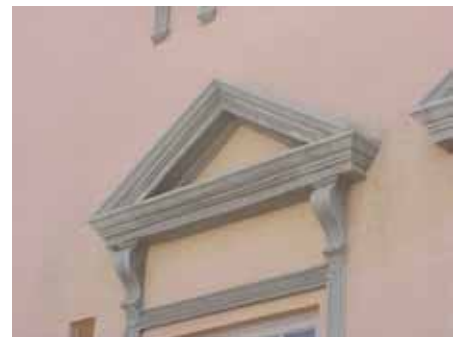
BRIGITTA 29 från N KORNISCH