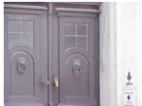
BRIGITTA 29 från V PORTKLAPP