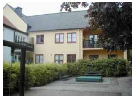
BRIGITTA 33 B från SO