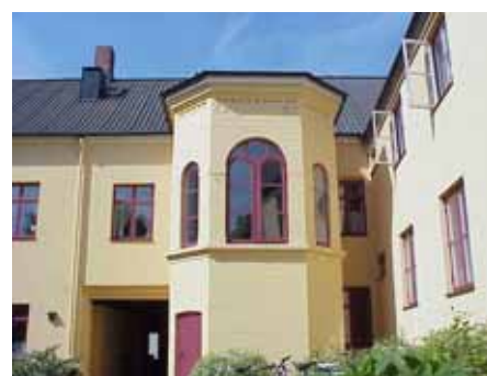
BRIGITTA 33 A från NO TRAPP- TORN