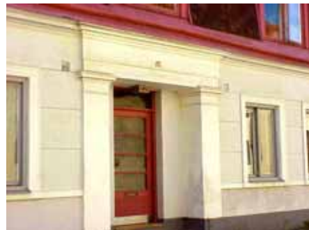
BRIGITTA 16 från SO PORTAL

fastighet: BRIGITTA 17. adress: Klostergatan 23. ålder: 1895. arkitekt / byggm: Peter Boisen. användning: Bostad. antal våningar: 2 sockel: Gråmålad cementputs. väggar: Tegel, målat vitt. tak: Sadeltak, grå skiffer. detaljer: Bruna 3-delade fönster. Brun teakdörr med sidoljus. Kraftig gesims med tandsnitt, strömskift, kopp- och löpskift. Gördelband och bröstningslister med strömskift. Stickbågar. Ståndränna.