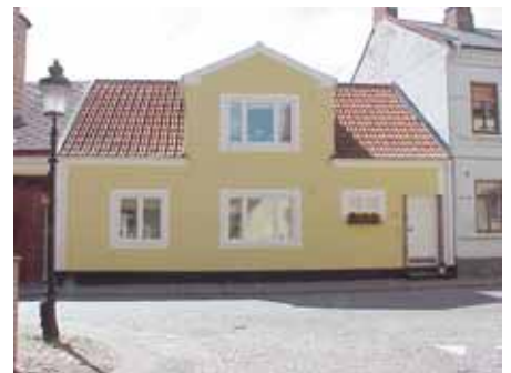
BRIGITTA 30 från O

Vita 2- och 3-luftsfnster. Vit lamelldörr. Vita fönsteromfattningar. Dörromfattning av rött tegel. Frontespis åt gatan. Vita rusticerade hörnkedjor. Avtrappad vit taklist. Takkupa åt gård, klädd med vit plåt.