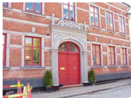
BRIGITTA 22 från SO PORTAL