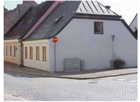
BRIGITTA 38 från NO

värdering kulturhistoriskt (K) K = 3, M = 2. miljömässigt (M):