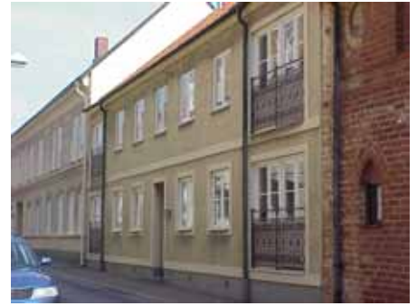
BRIGITTA 27 från S

värdering kulturhistoriskt (K) miljömässigt (M): K = 3, M = 2.