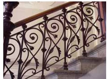
BRIGITTA 33 A TRAPPRÄCKE