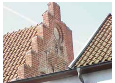
BRIGITTA 35 A från NO GAVEL