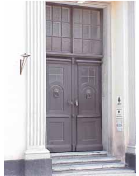
BRIGITTA 29 från V PORT