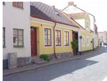
BRIGITTA 31 från SO

värdering K = 2, M = 2. kulturhistoriskt (K) miljömässigt (M):