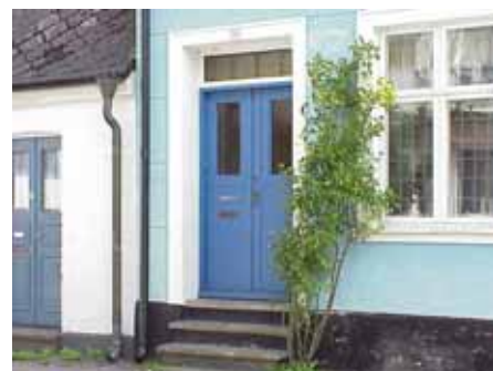
BRIGITTA 11 från NV DÖRR