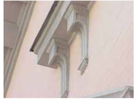
BRIGITTA 29 från N KONSOLER