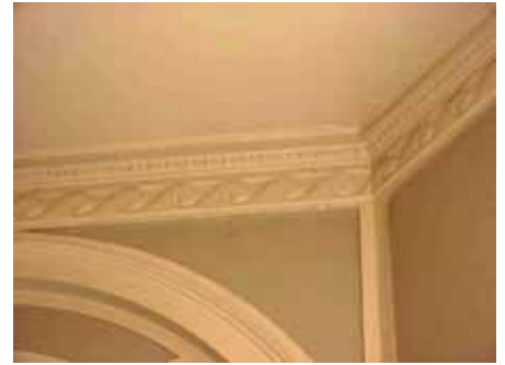
BRIGITTA 33 A TRAPPHUS TAK- LIST