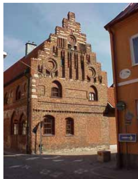
BRIGITTA 35 A från S