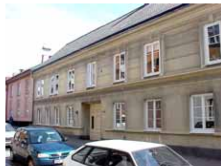
BRIGITTA 33 A från S

värdering kulturhistoriskt (K) K = 1, M = 2. Mycket genuint och välbevarat. Trapphuset är helt enligt originalritningen från 1892. miljömässigt (M):