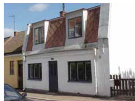
BRIGITTA 37 från NV

värdering kulturhistoriskt (K) miljömässigt (M): K = 3, M = 2.