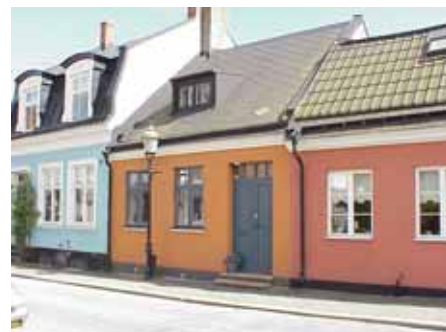
BRIGITTA 10 från NV