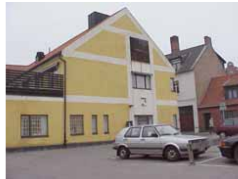
QVIRITES 24 E från O

fastighet: QVIRITES 24, hus F. adress: Liregatan 2. ålder: 1977. arkitekt / byggm: Nilsson & Persson. användning: Kontor. antal våningar: 1 sockel: Svartmålad puts. väggar: Gul puts. tak: Takterrass med brunt träräcke. detaljer: Vita dekorband.