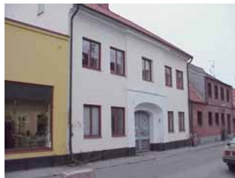
QVIRITES 3 A från SV

värdering kulturhistoriskt (K) miljömässigt (M): K = 3, M = 2.