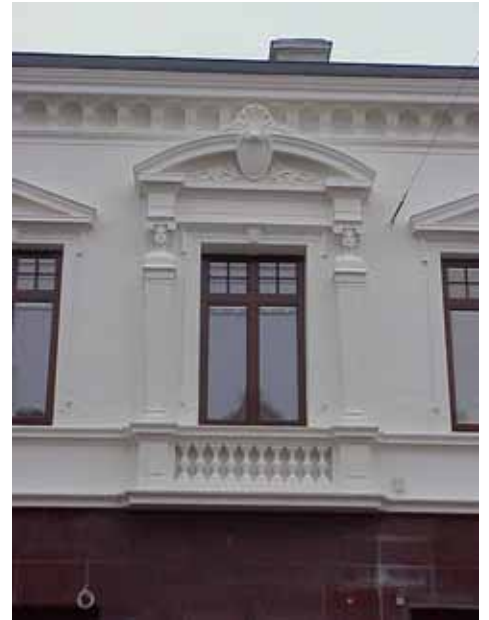
QVIRITES 24 A från V FÖNSTER