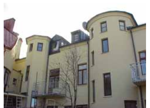
QVIRITES 24 A från NO