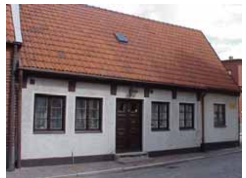
QVIRITES 5 från SV