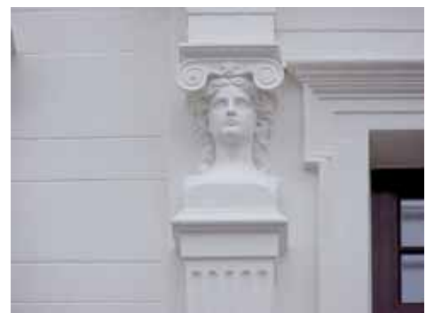
QVIRITES 24 A från V DETALJ