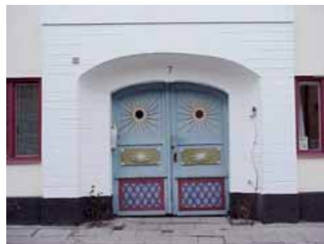
QVIRITES 3 A från S PORT

fastighet: QVIRITES 3, hus B. adress: Tullgatan 7. ålder: 1900 (som magasin). Ombyggd till smedja 1938, tillbyggd 1946. arkitekt / byggm: Peter Boisen. Rune Welin (1946). användning: antal våningar: sockel: väggar: tak: detaljer: