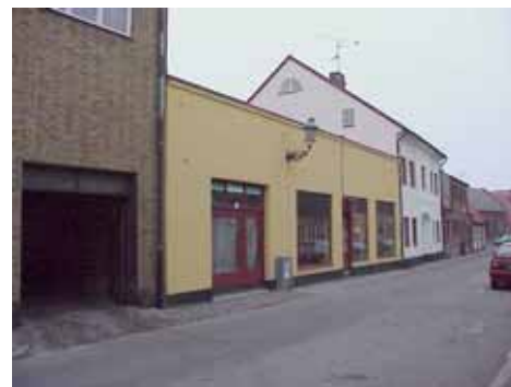
QVIRITES 23 från SV

värdering kulturhistoriskt (K) K = 5, M = 5 . miljömässigt (M):