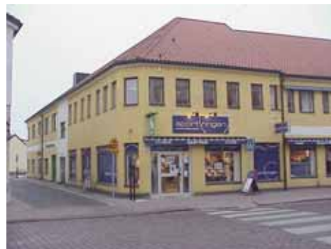
QVIRITES 24 D från V