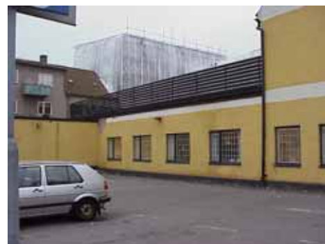
QVIRITES 24 F från NO

värdering kulturhistoriskt (K) miljömässigt (M): K = 5, M = 4.