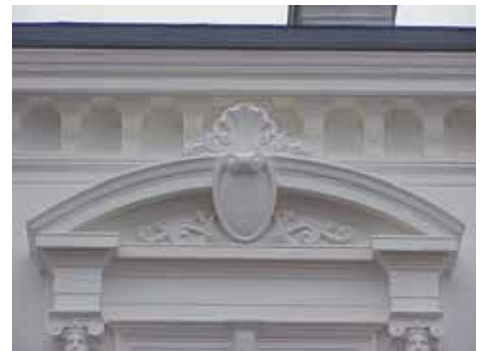
QVIRITES 24 A från V FRONTON