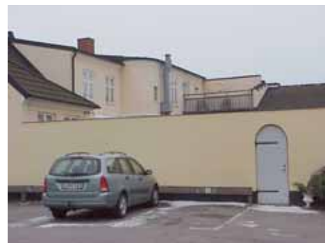
QVIRITES 14 A och B från SV