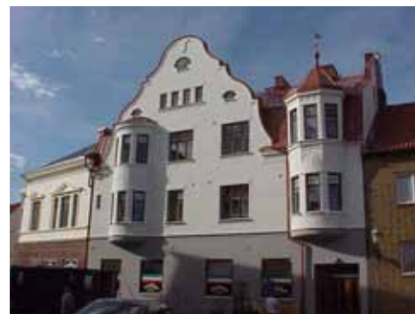
QVIRITES 24 B från SO