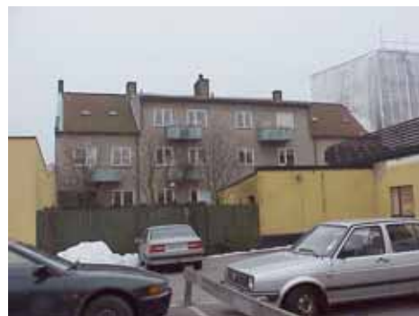
QVIRITES 24 C från N

fastighet: QVIRITES 24, hus D. adress: Hamngatan 9. ålder: 1977. Ombyggd 1989. arkitekt / byggm: Nilsson & Persson. (även 1989). användning: Kontor, affärer. antal våningar: 2 sockel: Svartmålad puts. väggar: Gul puts. tak: Sadeltak, valmat i hörnet, rött 1-kupigt tegel. detaljer: Svarta 1-lufts-fönster. Stora skyltfönster i botten-våning. Vita dekorband. Markiser mot Hamngatan.