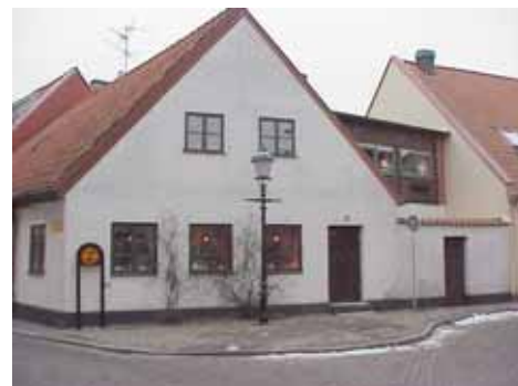
QVIRITES 6 från SO

fastighet: QVIRITES 7. adress: Stickgatan 26 D. ålder: 1975. arkitekt / byggm: Nilsson & Persson. användning: Bostad. antal våningar: 1½ sockel: Svart målad puts. väggar: Gul spritputs. tak: Sadeltak, rött 1-kupigt tegel. detaljer: Vita 2-lufts fönster. Rosa paneldörr med överljus. Vita dörr- och fönsteromfattningar.