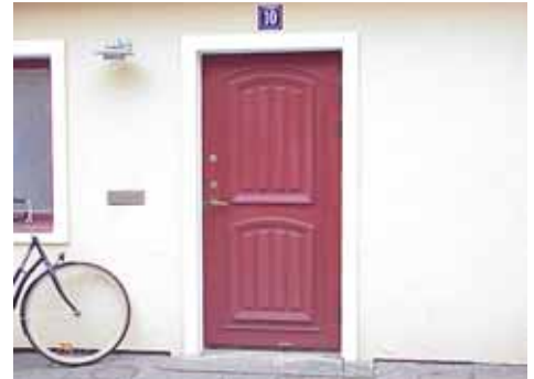
QVIRITES 18 från N DÖRR

fastighet: QVIRITES 19. adress: Stickgatan 26 A. ålder: 1975. arkitekt / byggm: Nilsson & Persson. användning: Bostad och damfrisering. antal våningar: 1½ sockel: Svart målad puts. väggar: Ljusblå spritputs. tak: Sadeltak, rött 1-kupigt tegel. detaljer: Vita 2-lufts fönster. Ljusblå paneldörr med överljus. Vita dörr- och fönsteromfattningar.