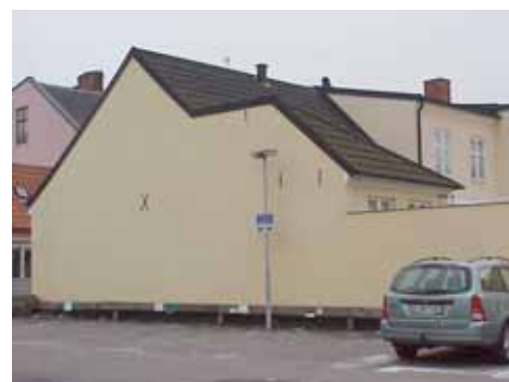
QVIRITES 14 A från SV

fastighet: QVIRITES 14, hus B. adress: Liregatan 8. ålder: Tillbyggd 1888. arkitekt / byggm: användning: 1 sockel: väggar: tak: detaljer: Takterrass med brunmålat träräcke.