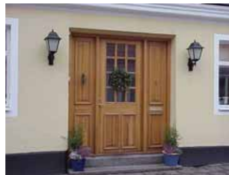
QVIRITES 14 A från N PORT