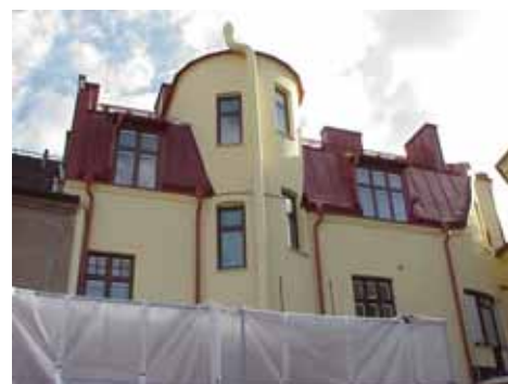
QVIRITES 24 B från N