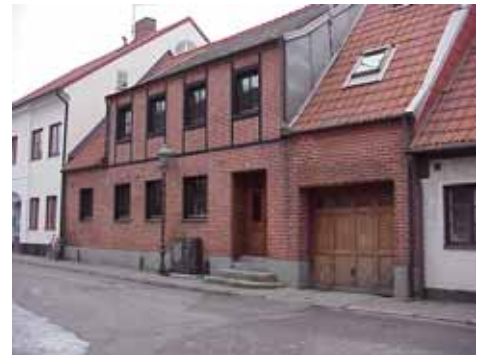
QVIRITES 4 från SO

fastighet: QVIRITES 5. adress: Tullgatan 11. ålder: Ombyggd 1925, 1958. arkitekt / byggm: Henrik Nilsson (1925), Karl Eriksson (1958). användning: Bostad. antal våningar: 1 sockel: Brunmålad puts. väggar: Vit spritputs. tak: Sadeltak, rött 2-kupigt tegel. detaljer: Bruna 2-lufts spröjsade fönster. Brun pardörr med profilerade speglar och små fönster. Slätputs runt dörr och fönster. Yttertrappa av cement med kalksten. Släta brunmålade knektar under takfot.