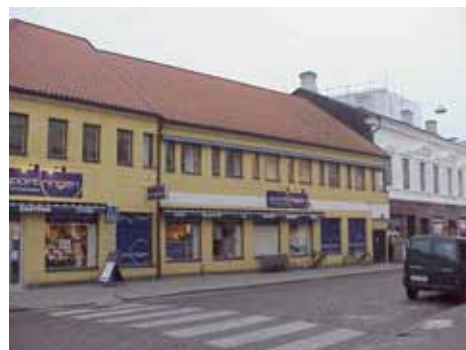
QVIRITES 24 D från NV