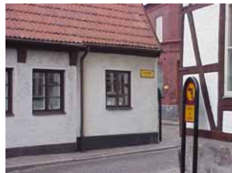
QVIRITES 6 från SV