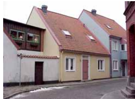
QVIRITES 7 från SO