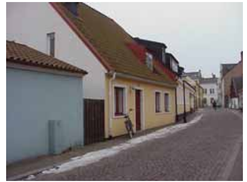
QVIRITES 18 från NO