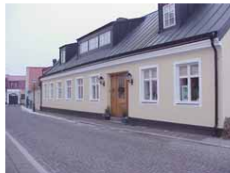
QVIRITES 14 A från NV