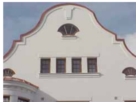
QVIRITES 24 B från S FRONTESPIS