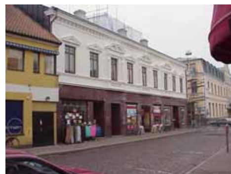
QVIRITES 24 A från NV

värdering kulturhistoriskt (K) K = 1, M = 1. miljömässigt (M): Fasaden renoveras 2005. Den röda marmorn (från 30-talet?) tas bort och ersätts med puts, den gamla dekoren återskapas.