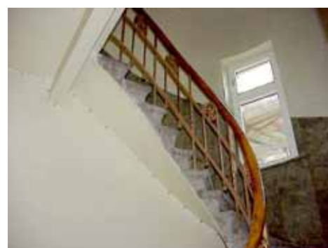
QVIRITES 24 B TRAPPHUS