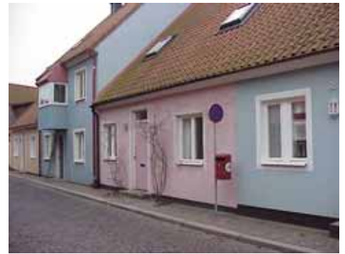
QVIRITES 20 från NO

fastighet: QVIRITES 21. adress: Stickgatan 26 C. ålder: 1975. arkitekt / byggm: Nilsson & Persson. användning: Bostad. antal våningar: 1½, 2½ mot gata. sockel: Svart målad puts. väggar: Blå spritputs. tak: Sadeltak, rött 1-kupigt tegel. detaljer: Vita 2-lufts fönster. Mörkblå paneldörr med överljus. Vita dörr- och fönsteromfattningar. Burspråk med rött plåttak.