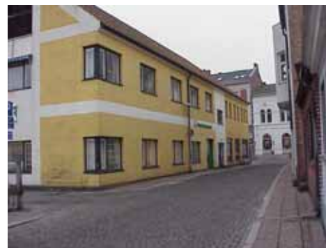
QVIRITES 24 E från NO

värdering kulturhistoriskt (K) miljömässigt (M): K = 3, M = 4.