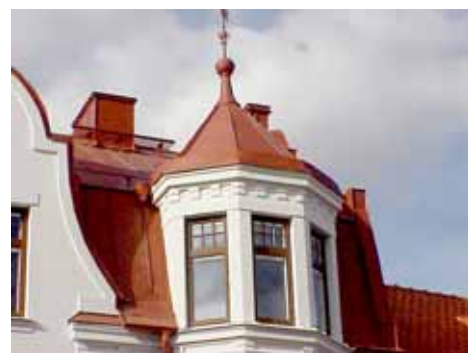
QVIRITES 24 B från S BURSPRÅK