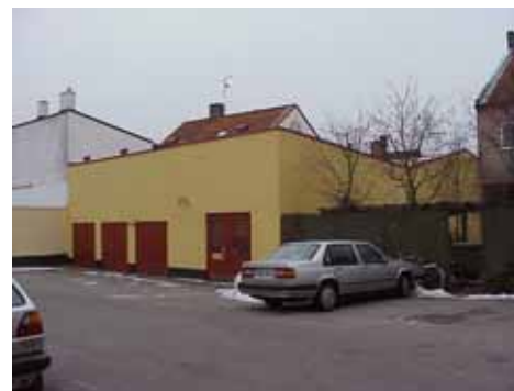
QVIRITES 23 från NV

fastighet: QVIRITES 24, hus A. adress: Hamngatan 11. ålder: Omkring 1860. Ombyggd 1913, 1937-38, 1944, 1950. arkitekt / byggm: Karl Eriksson (1938 och 1950). användning: Affärer, bostad. antal våningar: 2 + mansard åt gården. sockel: Ej synlig åt gatan. väggar: Röd marmor i bottenvåning, vit puts i ovanvåning. tak: Valmat, mansard mot gård. Grafitgrå plåt. detaljer: Stora skyltfönster i bottenvåningen. I ovanvåning bruna 4-lufts-fönster med spröjsad överdel. Glasade trädörrar. Elegant trappuppgång med grön marmor, innerdörr med facettslipade, metallinfattade glasrutor och överljus, svängd trappa och utsirat trapppräge. Hela övre våningens gatufasad är rikt utsmyckad med gesimser och gördelband, rusticeringar, frontoner, fönsteromfattningar med pilastrar, balusterdockor, kvinnohuvuden, musselornament. Vackra ritningar finns i arkivet (1913, Henrik Nilsson) på stor, elegant frontespis mot Hamngatan. Byggs tydligen ej.