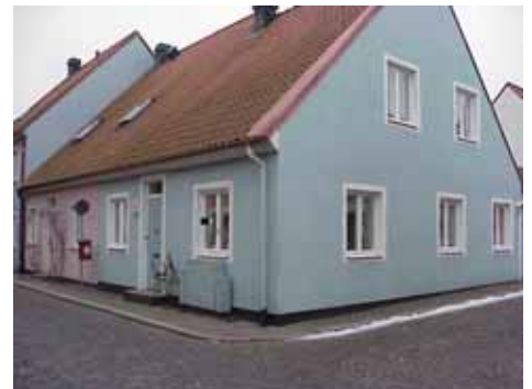
QVIRITES 19 från NO