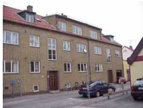
QVIRITES 24 C från SV