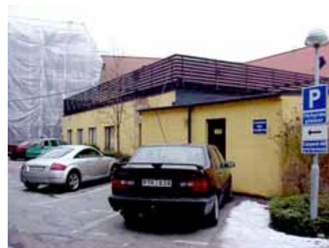
QVIRITES 24 F från SO