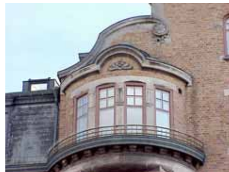
KARNA 7 C från N BURSPRÅK TOPP