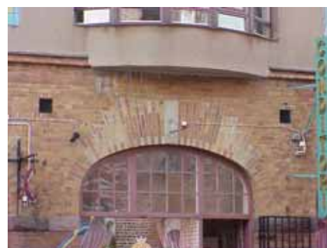
KARNA 7 B från N STICKBÅGE