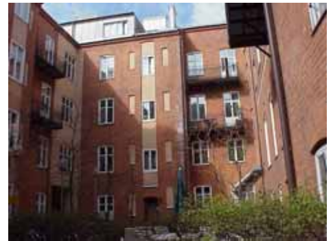
KARNA 7 A från O