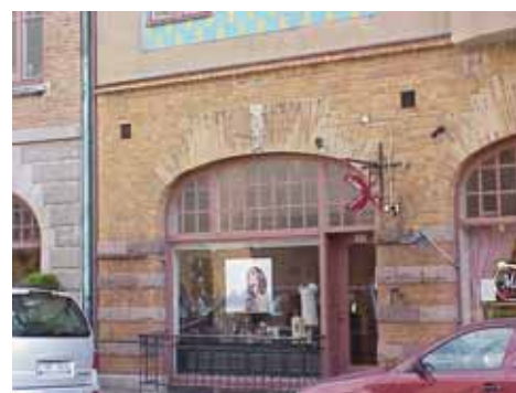
KARNA 7 B från NV SKYLTFÖNSTER