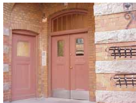
KARNA 7 A från NV PORT