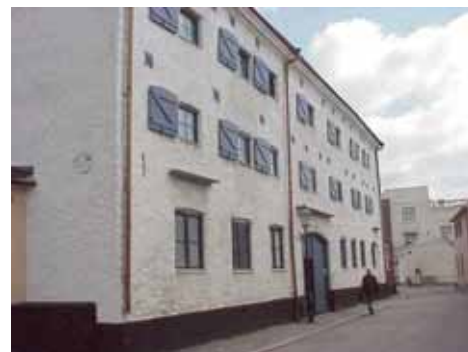
KARNA 5 D från SV

värdering kulturhistoriskt (K) K = 1, M = 1. miljömässigt (M): Se 5 A.