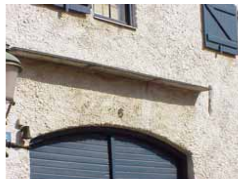
KARNA 5 D från SV SKÄRM