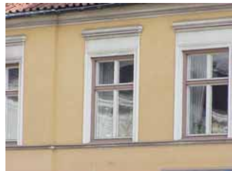
KARNA 4 A från NV FÖNSTER