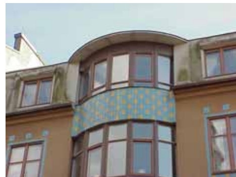
KARNA 7 B från NV BURSPRÅK