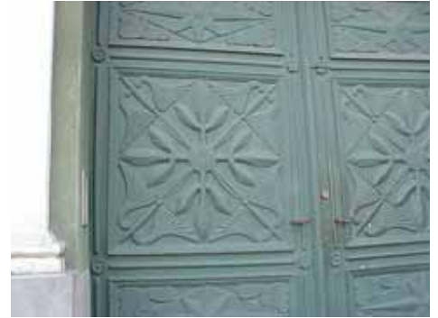
KARNA 5 A från N PORTSPEGEL