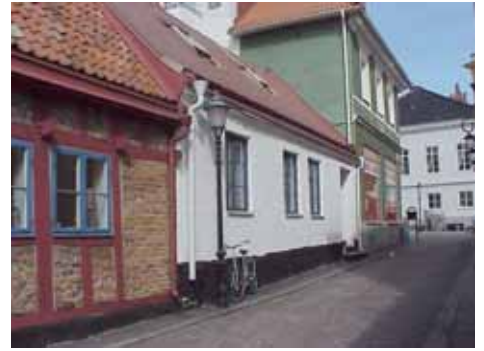
KARNA 5 B från SO

värdering K = 2(gata) 4(gård), M = 2(gata) 4(gård). kulturhistoriskt (K) Se 5 A. miljömässigt (M):