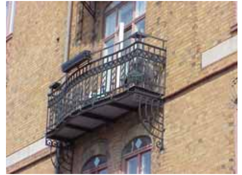
KARNA 7 A från S BALKONG