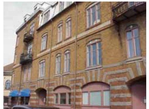
KARNA 7 A från SO