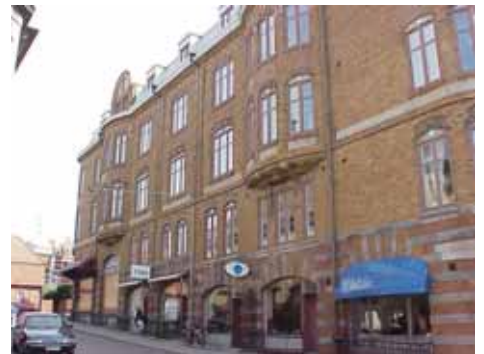
KARNA 7 A från SV