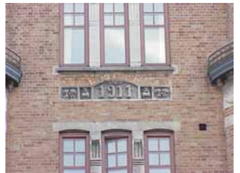
KARNA 7 C från N ÅRTAL