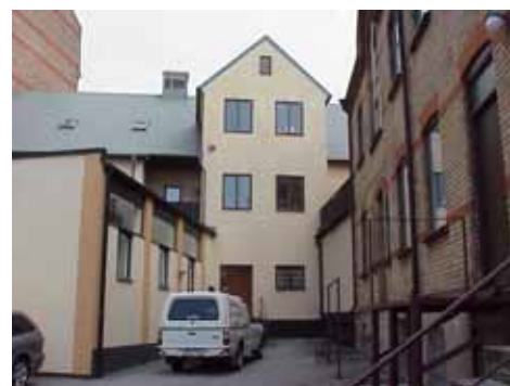
KARNA 4 A från S

fastighet: KARNA 4, hus B. adress: Långgatan 8. ålder: 1976. arkitekt / byggm: Göran Johansson. användning: Kontor. antal våningar: 1 sockel: Svartmålad puts. väggar: Gul puts. tak: Platt, troligen plåt. detaljer: Bruna hela fönster och ljusinsläpp av murade glasblock. Grå garageport av plåt. Vertikala band mellan fönstren, målade i gulbrunt.