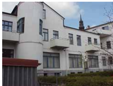
KARNA 5 E från O