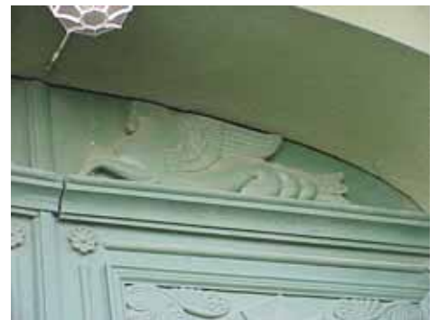
KARNA 5 A från N PORTDETALJ