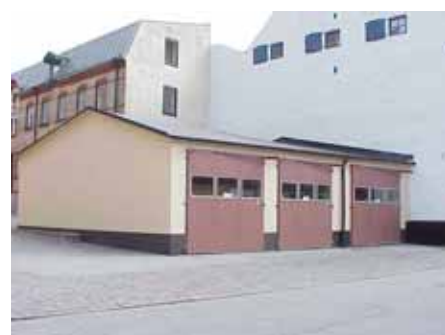
KARNA 4 D från SV

värdering kulturhistoriskt (K) K = 5, M = 4. miljömässigt (M):