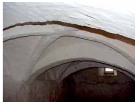
KARNA 5 D KÄLLARE 2