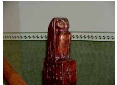
KARNA 7 D RÄCKESKNOPP