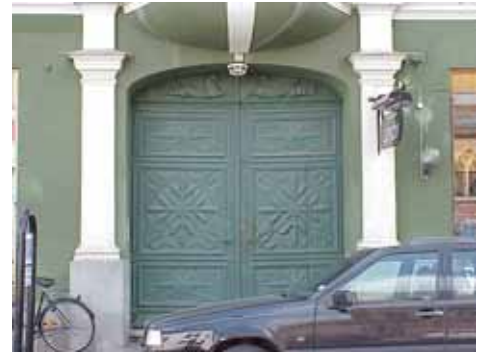
KARNA 5 A från N PORT