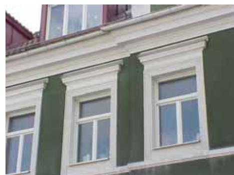
KARNA 5 A från NV FÖNSTER