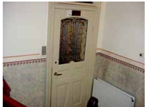
KARNA 7 C HISSDÖRR