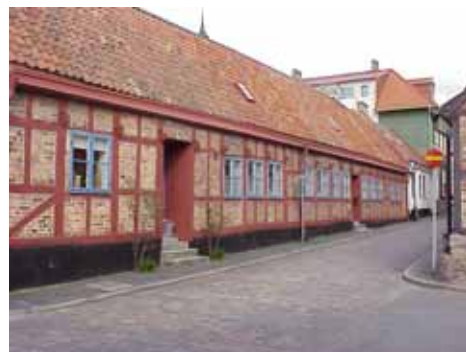
KARNA 5 C från SO

fastighet: KARNA 5, hus C. adress: Lilla Strandgatan 2. ålder: 1700-tal, norra delen tidigt 1800-tal. Ombyggt 1980. arkitekt / byggm: C. K. (1980). användning: Bostäder. antal våningar: 1 sockel: Svart puts. väggar: Korsvirke, röd timra med rött tegel i facken, mot gård grågrön timra och grå putsade fack. Grå spritputs på gavel mot söder. tak: Sadeltak, 1-kupigt rött gammalt tegel, mot gård svart papp. detaljer: Blå 2-lufts spröjsade fönster med gammalt glas och beslag, mot väster och söder vita fönster. Mycket fin blå pardörr med skurna speglar med blommönster och kannelyr. Blå dörr med släta speglar. Vit glasad ramdörr mot gård. Utskjutande bjälkhuvuden med tappar. Yttertrappor av kalksten. värdering kulturhistoriskt (K) K = 1(gata) 3(gård), M = 1(gata) 3(gård). miljömässigt (M): Se 5 A.