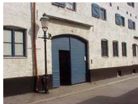
KARNA 5 D från SV PORT