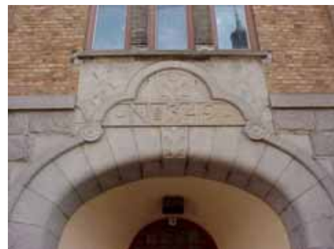
KARNA 7 C från N PORTAL