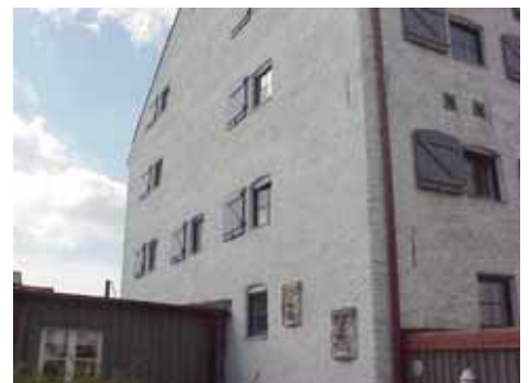
KARNA 5 D från NO