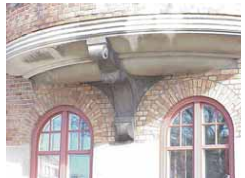
KARNA 7 D från SO BURSPRÄKS-KONSOL