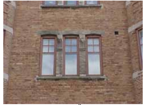
KARNA 7 C från N FÖNSTERPARTI