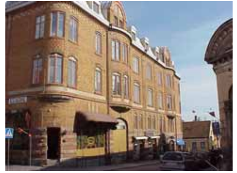
KARNA 7 A från NV