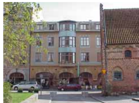
KARNA 7 B från N

värdering K = 2, M = 2. kulturhistoriskt (K) Se 7 A. miljömässigt (M):