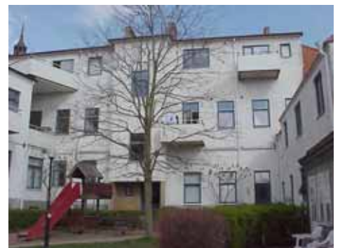
KARNA 5 A från SO