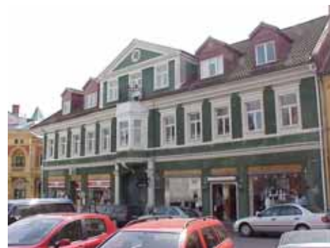
KARNA 5 A från NV

K = 1(gata) 4(gård), M = 1(gata) 4(gård). Den kringbyggda gården är en ombonad och attraktiv miljö, och husens volymer bidrar till det- ta. Fasaderna mot gården är dock kraftigt föränd- rade och har inget större värde i sig.