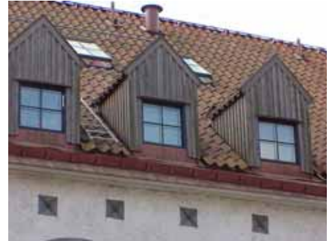
KARNA 5 D från N KUPOR