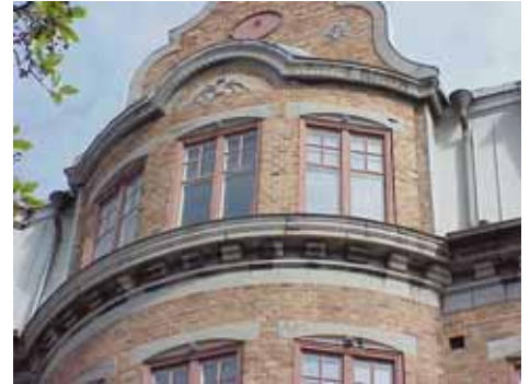
KARNA 7 D från SO DEKOR