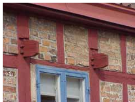
KARNA 5 C från SO BJÄLKAR