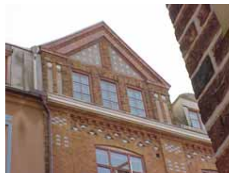
KARNA 7 A från NO FRONTESPIS