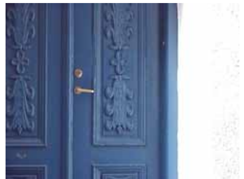
KARNA 5 B från O DÖRRDETALJ