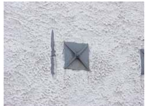
KARNA 5 D från N ANKARE