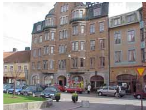
KARNA 7 C från NV

värdering K = 1, M = 1. kulturhistoriskt (K) Se 7 A. miljömässigt (M):