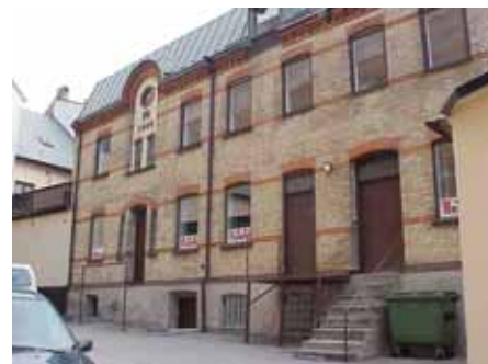
KARNA 4 C från SV

värdering kulturhistoriskt (K) K = 2, M = 2. miljömässigt (M): Lastbryggan bör tas bort, fönstren borde vara spröjsade.