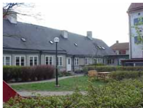
KARNA 5 C från NV