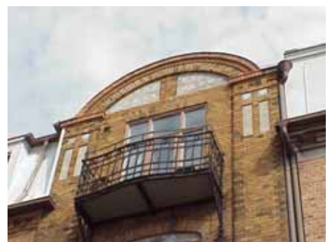
KARNA 7 A från S FRONTESPIS