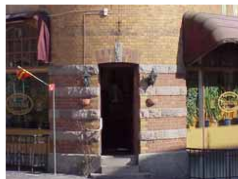
KARNA 7 A från NV ENTRÉ