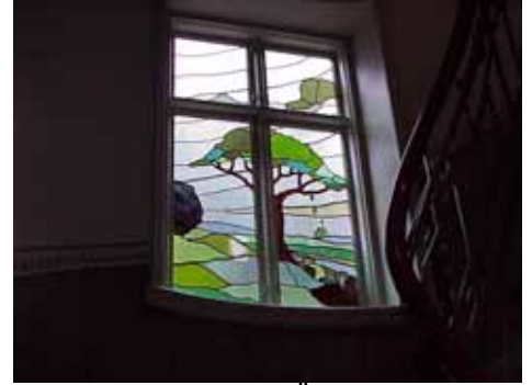
KARNA 7 D TRAPPFÖNSTER