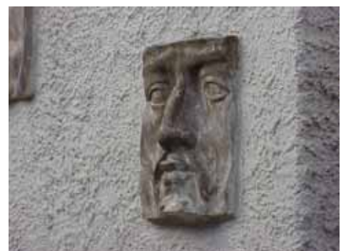
KARNA 5 D från NO MASK