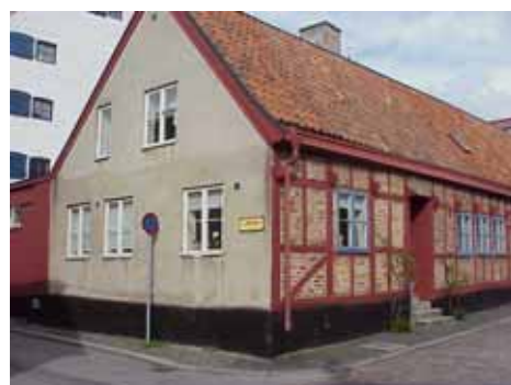
KARNA 5 C från SO GAVEL