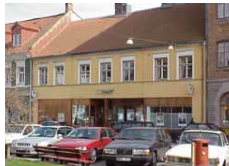
KARNA 4 A från NV

värdering kulturhistoriskt (K) K = 4, M = 3. miljömässigt (M): Ursprungligen ett vackert hus med fina proportioner, men den uppglasade bottenvåningen har förvanskats husets karaktär.