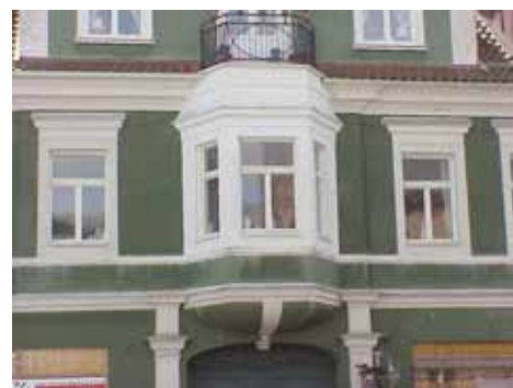
KARNA 5 A från N BURSPRÅK