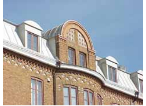
KARNA 7 A från NV FRONTESPIS