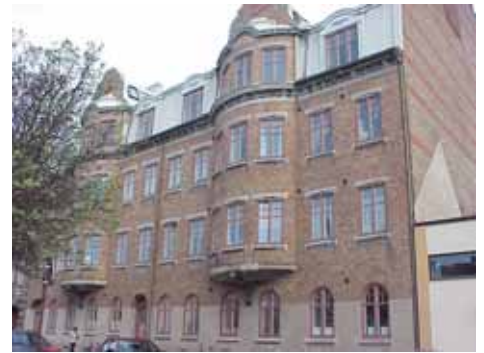
KARNA 7 D från SO

värdering kulturhistoriskt (K) K = 1, M = 1. miljömässigt (M): Se 7 A.