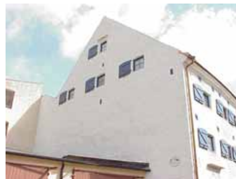
KARNA 5 D från SV GAVEL