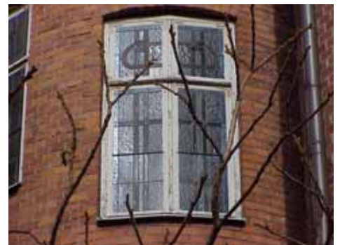
KARNA 7 A från SO TRAPPHUS- FÖNSTER