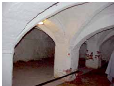
KARNA 5 D KÄLLARE 1