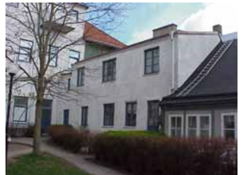
KARNA 5 B från S