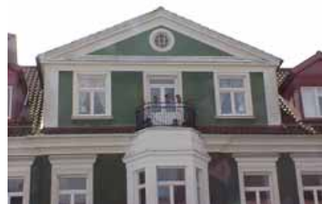
KARNA 5 A från N FRONTESPIS