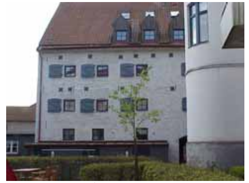
KARNA 5 D från N