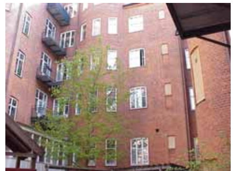
KARNA 7 C från SV