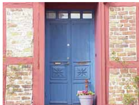
KARNA 5 C från O DÖRR