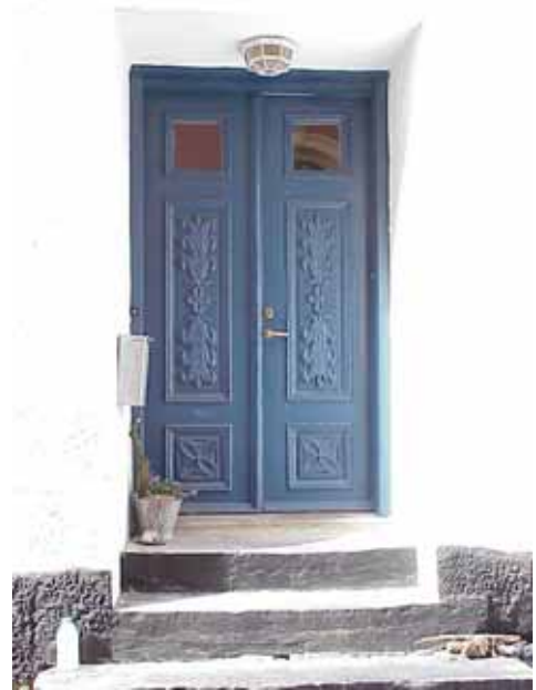
KARNA 5 B från O DÖRR