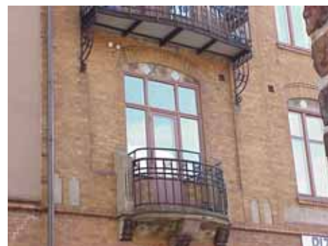
KARNA 7 A från NO BALKONGER