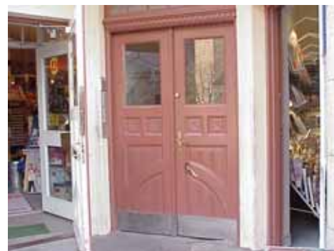
KARNA 7 C från NV PORT