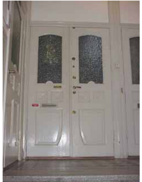
KARNA 7 C LÄGENHETSDÖRR