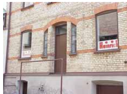
KARNA 4 C från SV FÖRUT INGÅNG