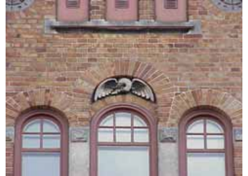
KARNA 7 C från N DEKOR