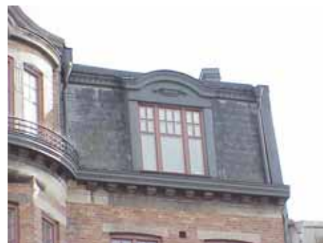
KARNA 7 C från N MANSARD