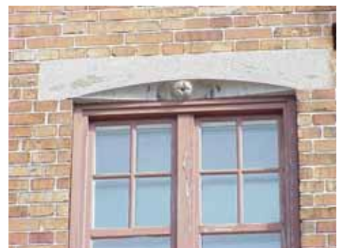
KARNA 7 D från S FÖNSTERDEKOR