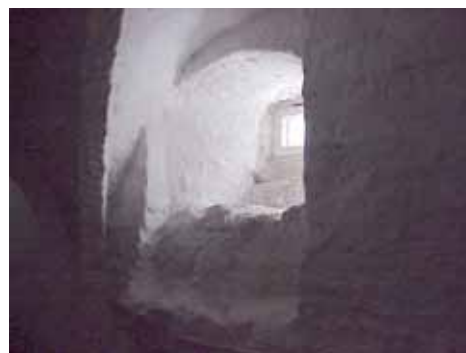
KARNA 5 D KÄLLARE 4