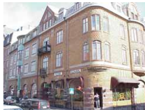
KARNA 7 A från NV HÖRN

värdering kulturhistoriskt (K) K = 1, M = 1. Ett välbevarat, stilenligt och väl sammanhållet kvarterskomplex, som är unikt för Ystad. miljömässigt (M):