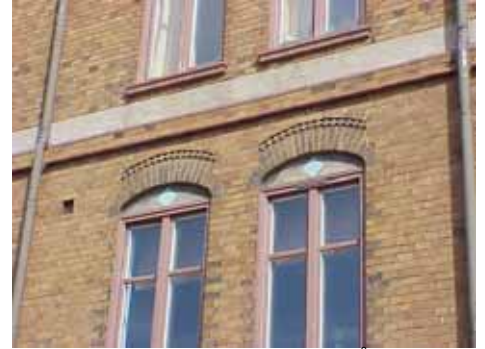
KARNA 7 A från SO STICKBÄGAR