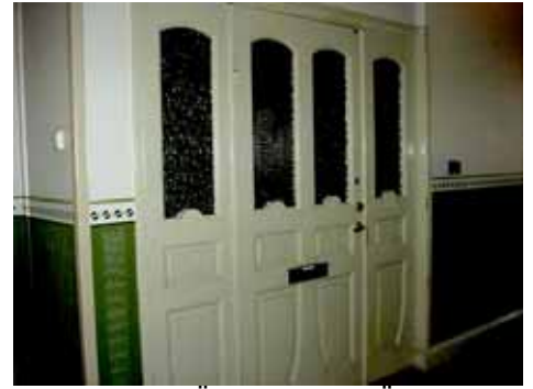
KARNA 7 D LÄGENHETSDÖRR