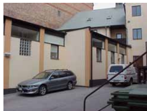
KARNA 4 B från SO

värdering kulturhistoriskt (K) K = 5, M = 5. miljömässigt (M): Har viss elegans, men är helt malplacerad.