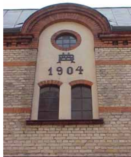
KARNA 4 C från V DEKOR

fastighet: KARNA 4, hus D. adress: Långgatan 8. ålder: 1953. arkitekt / byggm: Bertil Sandin. användning: Garage. antal våningar: 1 sockel: Svartmålad puts. väggar: Glasfiberväv, målad gul med ballast i färgen. tak: Sadeltak, grå papp. detaljer: Tre garageportar med fönster, brun plåt med mönster av stående panel.