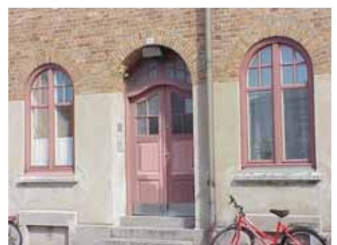
KARNA 7 D från S PORT