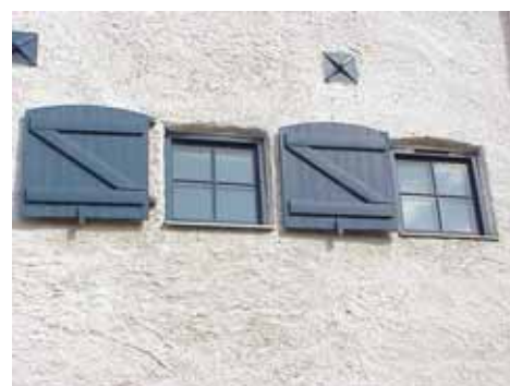
KARNA 5 D från S LUCKOR