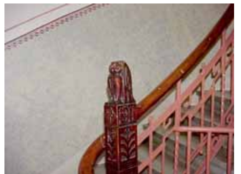
KARNA 7 C TRAPPSTOLPE