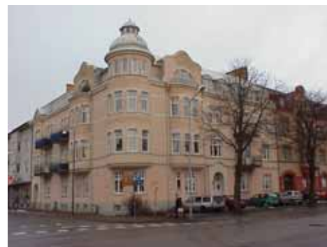
ÖSTEN 7 från SV

värdering kulturhistoriskt (K) K = 1, M = 1. miljömässigt (M): Mycket välbevarat med många ursprungliga detaljer. Väldigt stor betydelse för miljön med sitt framträdande hörnläge vid torget.