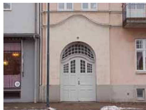
ÖSTEN 7 från V PORT