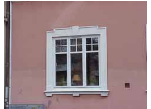
ÖSTEN 3 från N FÖNSTER