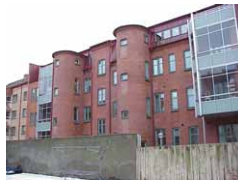
ÖSTEN 5 från NV