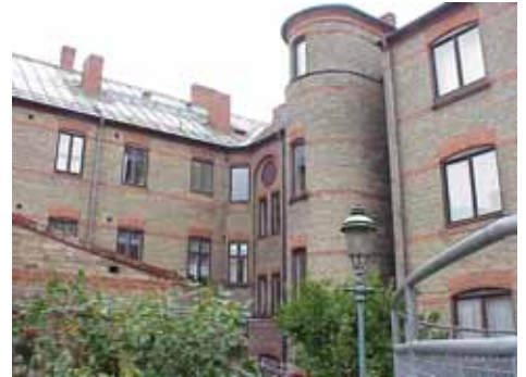
ÖSTEN 4 från SV