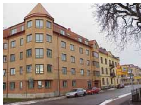
ÖSTEN 6 från SO

Mycket väl anpassat till omgivningen, tar upp formspråket hos grannarna utan att plagiera. Balkongerna mot gården kunde gjorts diskretare i färg och form.