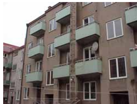
ÖSTEN 2 från SO

fastighet: ÖSTEN 3. adress: Bollhusgatan 12. ålder: 1905. Ombyggt 1986. arkitekt / byggm: Peter Boisen. Nilsson & Persson (1986). användning: Bostäder. antal våningar: 2, delvis 3 åt gård. sockel: Brunmålad puts. väggar: Rödmlad puts. Gult tegel åt gård. tak: Sadeltak, rött 1-kupigt tegel. detaljer: Vita 2- och 3-luftsfnster med spröjsade överbågar, åt gård nya vita fnster. Tredelad port med spröjsat svängt överljus och ramdörrar med fyllningar. Profilerad gesims och gördelband. Vita profilerade dörr- och fnsteromfattningar. Rusticerat, något framspringande mittparti med port, balkong och fronton med svängt fnster. 6 små takkupor, klädda med brungul plåt. Utanpåliggande runda trapphus åt gård. Portgenomgång med marmorgolv och nedre delen av väggarna träpanelklädda. Vackra ritningar i arkivet.