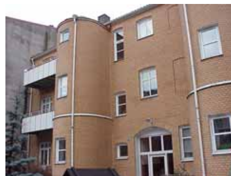
ÖSTEN 3 från SO