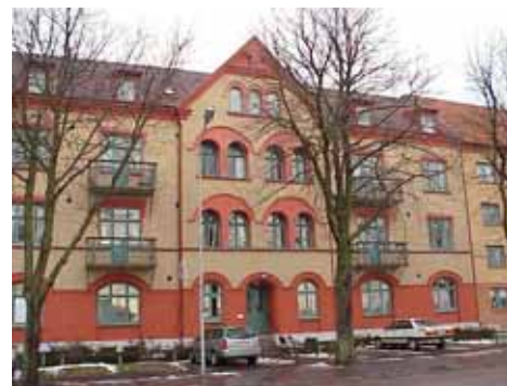
ÖSTEN 5 från S ENTRÉPARTI