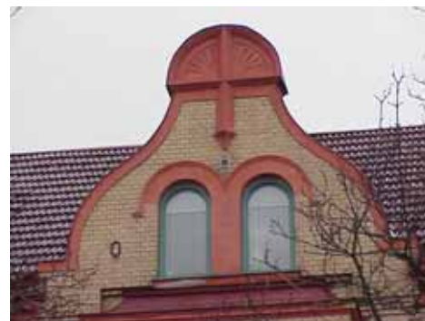
ÖSTEN 5 från S FRONTESPIS