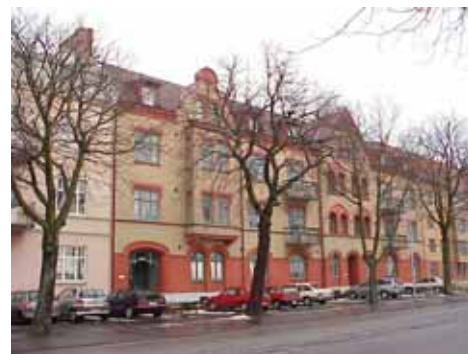
ÖSTEN 5 från SV

K = 2(gata) 4(gård), M = 1(gata) 2(gård). Många välbevarade detaljer. Den röda putsfär- gen är för skarp, bör dämpas vid nästa ommål- ning. De illa anpassade, påklistrade balkongerna åt gården skämmer den annars vackra tegelfa- saden, men huset är viktigt för gårdsmiljön.