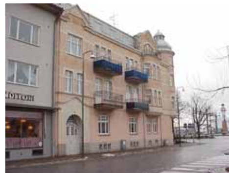
ÖSTEN 7 från NV