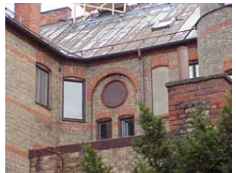
ÖSTEN 4 från SV TRAPPFÖNSTER