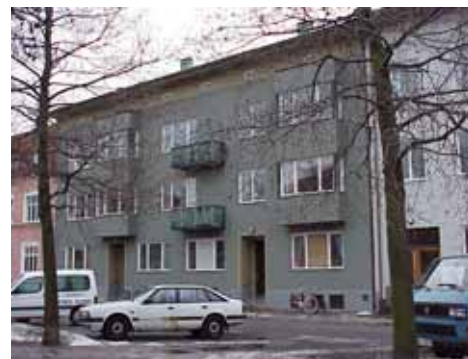
ÖSTEN 2 från NV

värdering kulturhistoriskt (K) miljömässigt (M): K = 3, M = 2.