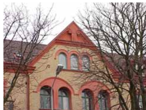
ÖSTEN 5 från S FRONTESPIS