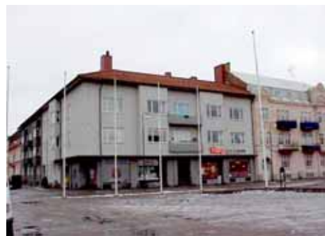
ÖSTEN 1 från V

värdering kulturhistoriskt (K) K = 2, M = 1. miljömässigt (M): Fint exempel på funkis, mycket viktig för torgmiljön.