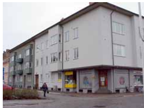
ÖSTEN 1 från NV