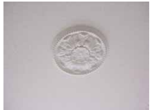
ÖSTEN 4 TAKROSETT