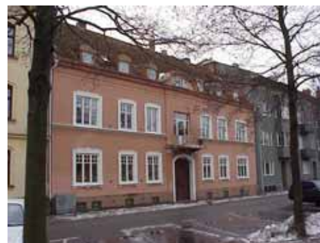
ÖSTEN 3 från NO

värdering kulturhistoriskt (K) miljömässigt (M): K = 2, M = 2.