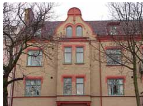
ÖSTEN 5 från S BURSPRÅK