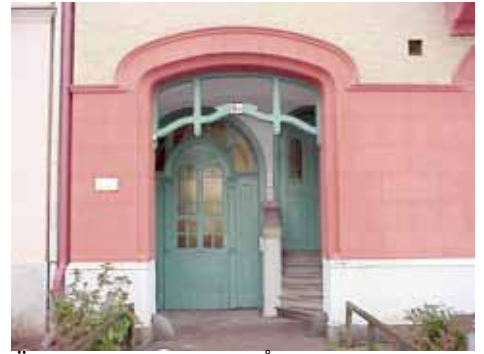
ÖSTEN 5 från S INGÅNG