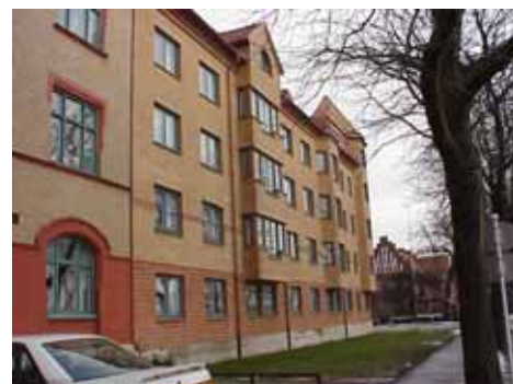
ÖSTEN 6 från SV