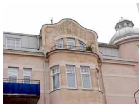
ÖSTEN 7 från V FRONTESPIS