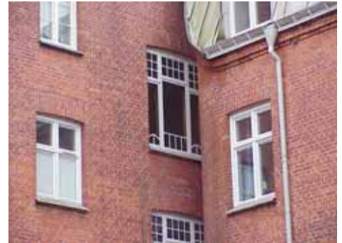
ÖSTEN 7 från NO FÖNSTER