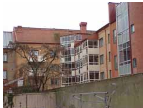
ÖSTEN 6 från NV