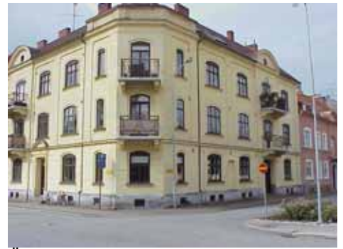
ÖSTEN 4 från NO