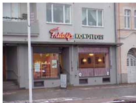
ÖSTEN 1 från V SKYLTT