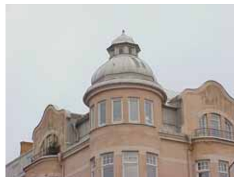
ÖSTEN 7 från SV HÖRNTORN