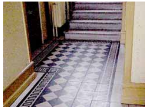
ÖSTEN 4 KAKELGOLV