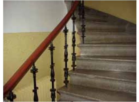
ÖSTEN 4 TRAPPRÄCKE