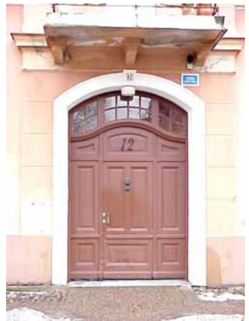
ÖSTEN 3 från N PORT