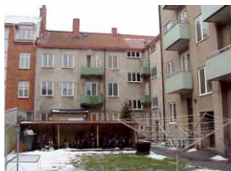
ÖSTEN 1 från O