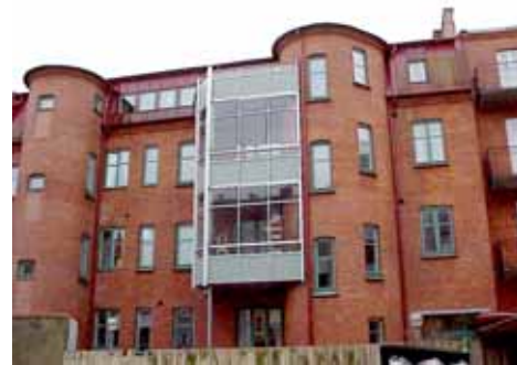
ÖSTEN 5 från N BALKONGER