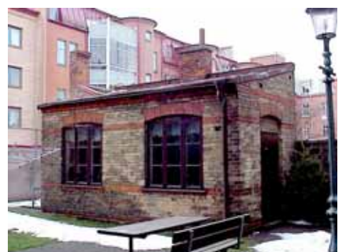
ÖSTEN 4 GÅRDSHUS