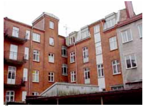
ÖSTEN 7 från NO