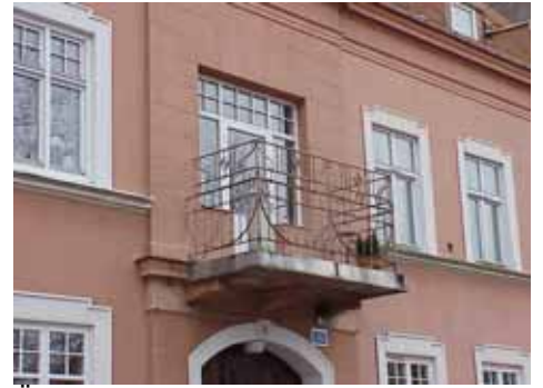
ÖSTEN 3 fr. NO BALKONG