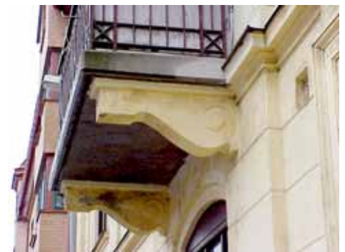
ÖSTEN 4 från NO BALKONGKONSOL