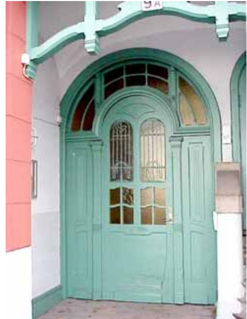
ÖSTEN 5 från S GÅRDSPORT