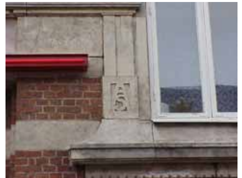
THOR 15 A från SV BOMÄRKE