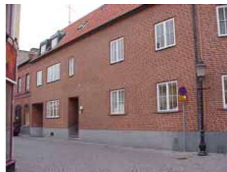
THOR 6 D från O

fastighet: THOR 6, hus D. adress: Böckaregatan 11. ålder: 1967. arkitekt / byggm: Rune Welin. användning: Bostäder, lokaler. antal våningar: 2 sockel: Gråmålad puts. väggar: Rött tegel. tak: Sadeltak, rött 1-kupigt tegel. detaljer: Vita 2-lufts korspröjsade fönster. Portgång genom huset med grön stålgrind. Kalkstenstrappa upp till gård.