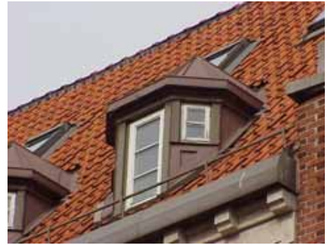
THOR 15 A från SV KUPA