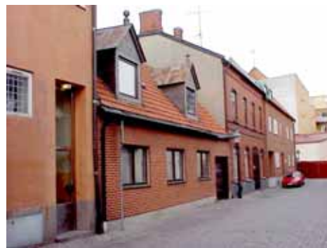
THOR 4 från SV

värdering K = 4, M = 3. kulturhistoriskt (K) Små nätta kupor, men fasaden i övrigt är förvanskad. miljömässigt (M):