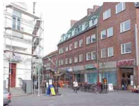
THOR 15 B från V