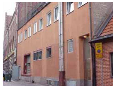
THOR 15 D från O

värdering kulturhistoriskt (K) miljömässigt (M): K = 5, M = 4.