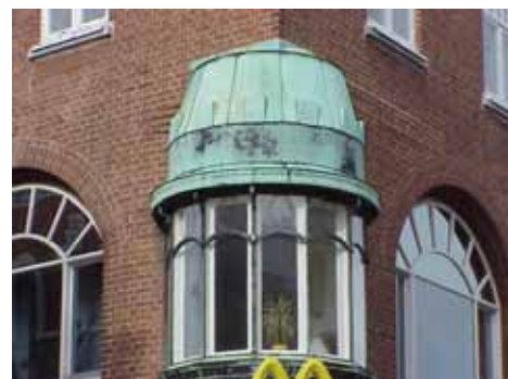
THOR 15 A från SV BURSPRÅK DETALJ