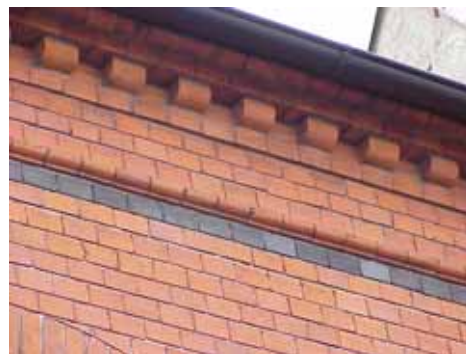
THOR 5 B från S GESIMS

fastighet: THOR 5, hus C. adress: Böckaregatan 9. ålder: 1800-tal. Ombyggt 1894, 1912. arkitekt / byggm: Henrik Nilsson (1912). användning: Bostäder. antal våningar: 2 sockel: Gråmålad puts. väggar: Grön puts. tak: Mansardtak, grå plåt. detaljer: Bruna spröjsade fönster, olika storlekar. Bruna spegeldörrar. Vita dörr- och fönsteromfattningar.