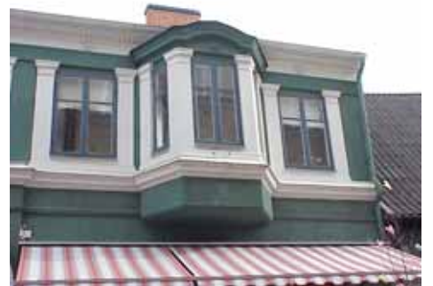
THOR 5 A från N BURSPRÄK