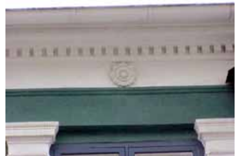
THOR 5 A från N GESIMSROS