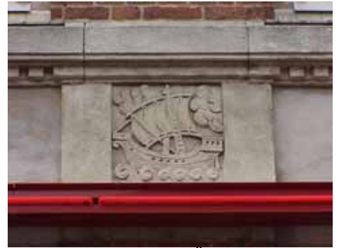
THOR 15 A från SV GÖRDELDEKOR