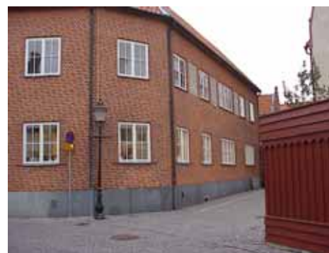
THOR 6 B från SO

fastighet: THOR 6, hus C. adress: Stora Östergatan 10. ålder: 1967. arkitekt / byggm: Rune Welin. användning: Affär, bostäder. antal våningar: 2, 2½ i östra delen. sockel: Grå stenplattor. väggar: Rött tegel, östgavel har korsvirkesmönster med grå timra och vitslammade tegelfack. tak: Sadeltak, rött 1-kupigt tegel. detaljer: Vita 2-lufts korspräjsade fönster. Stora bruna skyltfönster i bottenvåning. Bruna glasade ramdörrar av metall. Partier med gult tegel mellan fönstren mot norr i ovanvåning. Tre kopparklädda kupor mot norr. Portgång genom huset med grön stålgrind.