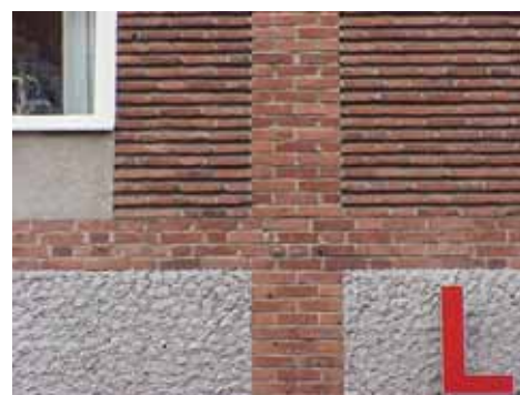
THOR 15 B från V FASADDETALJ