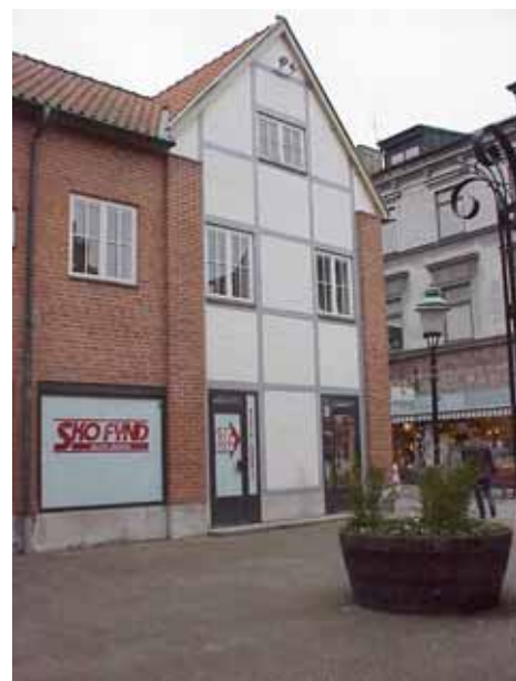
THOR 6 C från SO