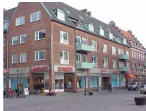
THOR 15 B från NV