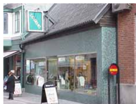
THOR 7 från NV

fastighet: THOR 7. adress: Stora Östergatan 6. ålder: 1800-tal. Ombyggt 1912, 1924, 1933, 1971. arkitekt / byggm: Henrik Nilsson (1912 och 1924), G. H. Hansson (1933). användning: Butik. antal våningar: 1 sockel: Blågrön mosaik. väggar: Sadeltak, svart korrugerad eternit. tak: Stora skyltfönster med stålram. Glasad stålramdörr. Indragen entré. Mörkbrunt trä i takfoten. detaljer: