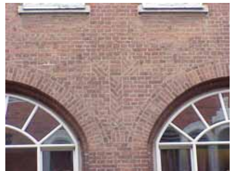
THOR 15 A från V MÖNSTERMUR- NING