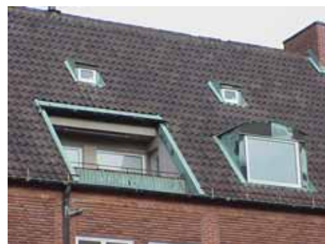
THOR 15 B från NV TAKVÅNING