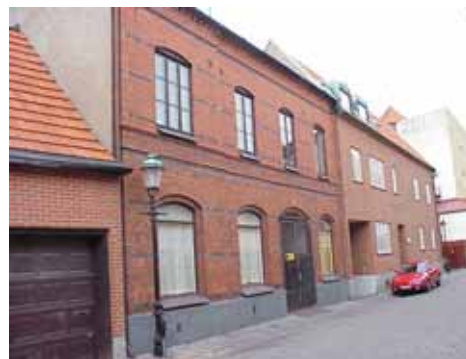
THOR 5 B från SV