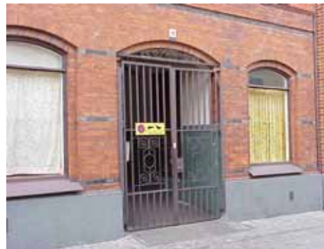
THOR 5 B från SV GRIND