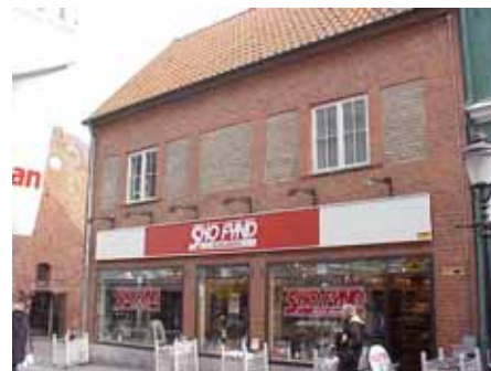
THOR 6 C från NV

fastighet: THOR 6, hus D. adress: Böckaregatan 11. ålder: 1967. arkitekt / byggm: Rune Welin. användning: Bostäder, lokaler. antal våningar: 2 sockel: Gråmålad puts. väggar: Rött tegel. tak: Sadeltak, rött 1-kupigt tegel. detaljer: Vita 2-lufts korspröjsade fönster. Portgång genom huset med grön stålgrind. Kalkstenstrappa upp till gård.