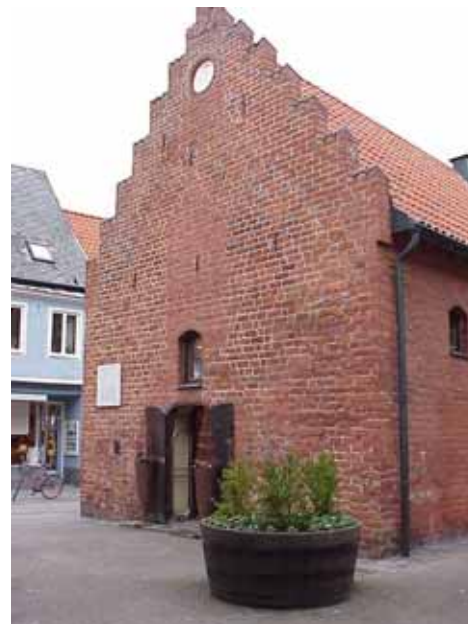
THOR 6 A från SV