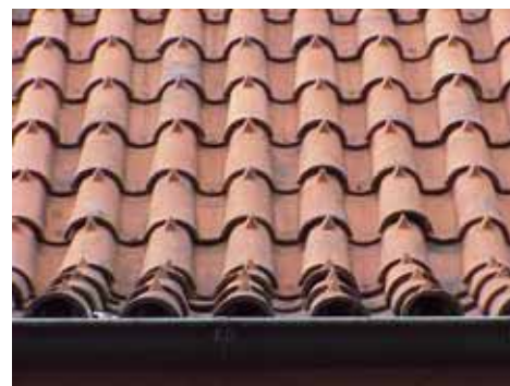
THOR 6 A från SO TAK