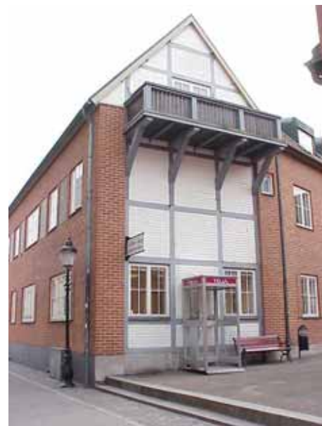
THOR 6 B från N