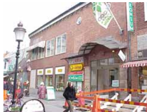
THOR 15 C från NV

värdering kulturhistoriskt (K) miljömässigt (M): K = 2, M = 2.