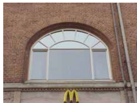
THOR 15 A från SO FÖNSTER