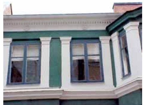
THOR 5 A från N FÖNSTER