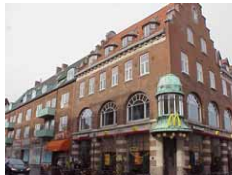
THOR 15 A från SV