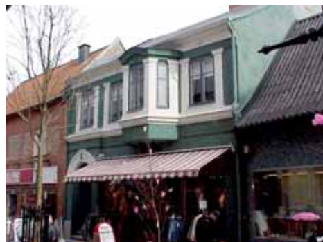
THOR 5 A från NV

värdering K = 2, M = 2. kulturhistoriskt (K) Vackert utsmyckad gatufasad, men alltför stora skyltfönster i bottenvåningen. miljömässigt (M):