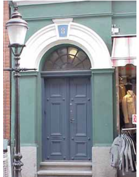
THOR 5 A från N PORT