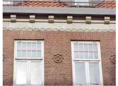
THOR 15 A från V GESIMS