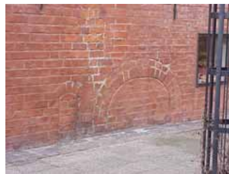
THOR 6 A från SV DÖRRHÅL