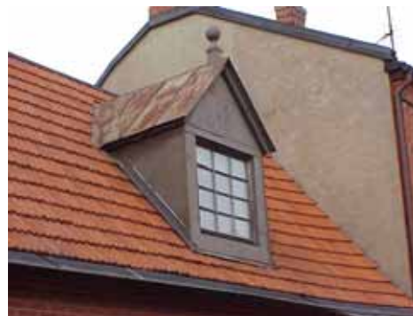
THOR 4 från SV KUPA

fastighet: THOR 5, hus A. adress: Stora Östergatan 8. ålder: 1800-tal. Ombyggt 1894, 1910, 1912, 1944, 1954. arkitekt / byggm: Henrik Nilsson (1910 och 1912), Jan Korning (1944), Rune Welin (1954). användning: Affär och bostäder. antal våningar: 2, 3 mot gård. sockel: Gråmålad puts. väggar: Grön puts. tak: Sadeltak, mansard mot gård, grå korrugerad plåt. detaljer: Blå 2-lufts spröjsade fönster. Stora skyltfönster i bottenvåning. Blå parport med speglar och knoppar, och med rundat, järnspröjsat överljus. Brun glasad ramdörr med vackert trycke. Elegant utformat burspråk mot norr. Vita fönsteromfattningar med pilastrar och ett rikt profilerat bröstningsband på ovanvåningen. Kraftig vit profilerad gesims med tandsnittslist och stuckaturblommor. Portal med pilastrar och en bred vit profilerad båge.