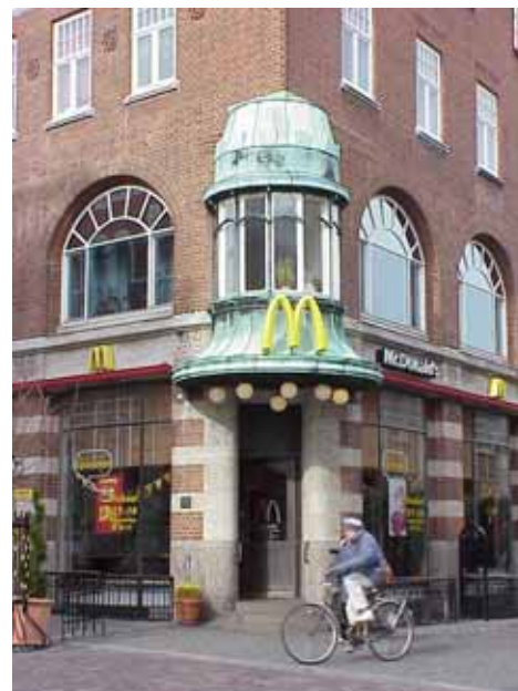
THOR 15 A från SV BURSPRÅK