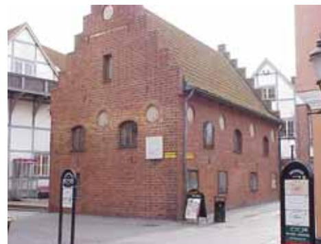
THOR 6 A från NO

värdering K = 1, M = 1. kulturhistoriskt (K) Förklarad för byggnadsminne. miljömässigt (M):