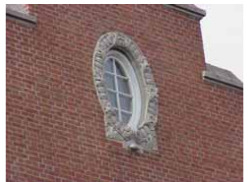
THOR 15 A från SV FÖNSTERRAM