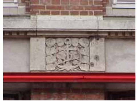
THOR 15 A från SV GÖRDELDEKOR