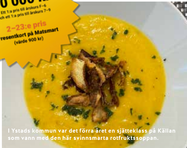
I Ystads kommun var det förra året en sjätteklass på Källan som vann med den här svinnsmarra rotfruktssoppa.

2-23:e pris Presentkort på Matmart (värde 900 kr)