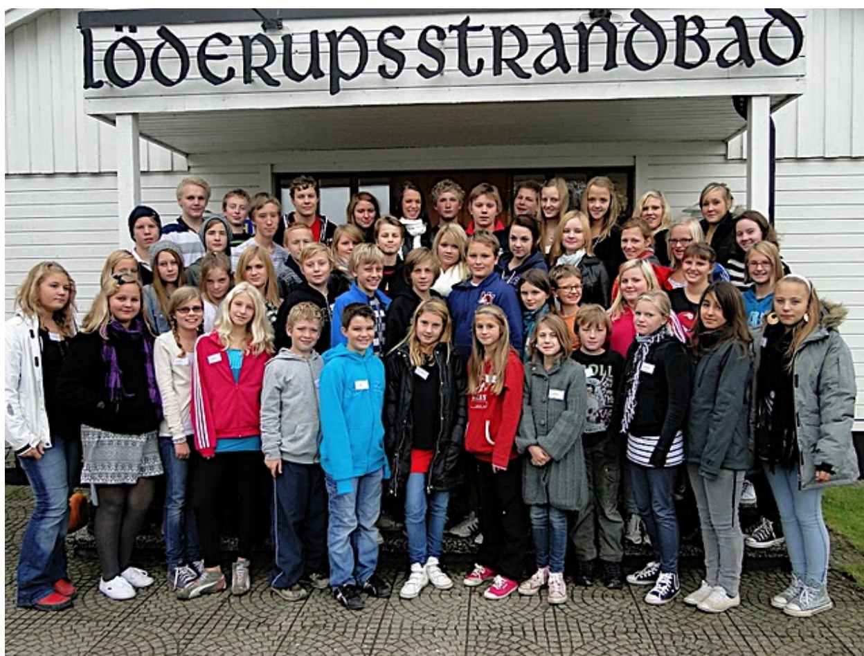
Här är alla elever samlade, som utgör Ungdomsfullmäktige 2010/2011