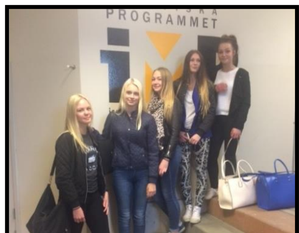
Bilder: Småkommuner mot droger